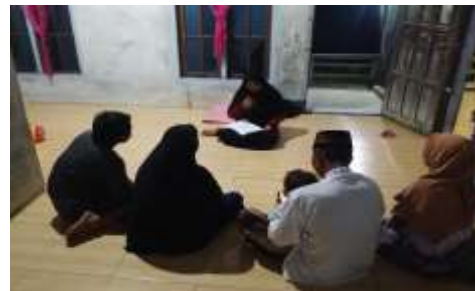
Dokumentasi wawancara kepada Informan III Lokasi Desa Wonorejo RT.12 RW.00