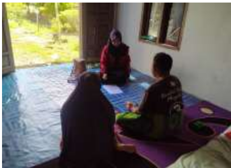
Dokumentasi wawancara kepada Informan II Lokasi Desa Wonorejo RT.13 RW.00