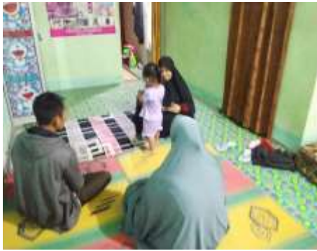
Dokumentasi wawancara kepada Informan I Lokasi Desa Wonorejo RT.02 RW.00