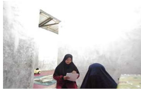
Dokumentasi wawancara kepada Informan IV Lokasi Desa Wonorejo RT.11 RW.00