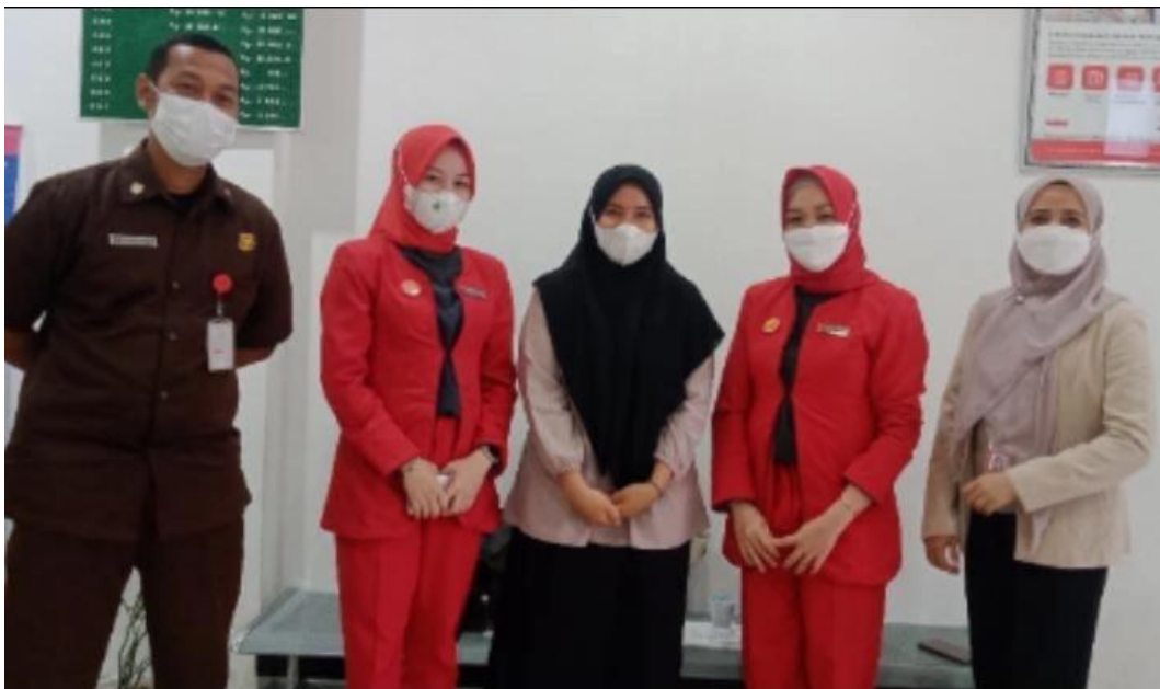
Dokumentasi bersama karyawan Bank Sinarmas Syariah Kcs Banjarmasin