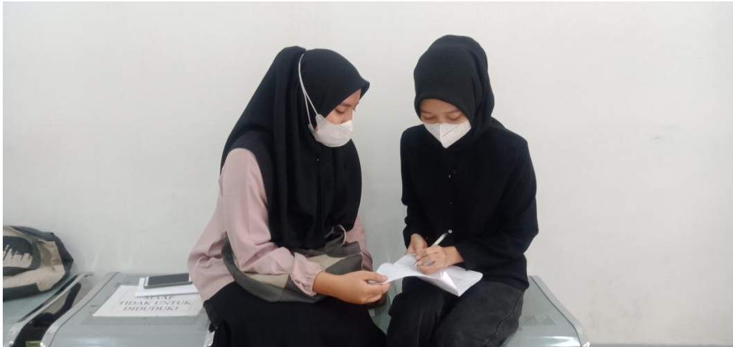
Dokumentasi pembagian angket kepada nasabah Bank Sinarmas Syariah Kcs Banjarmasin