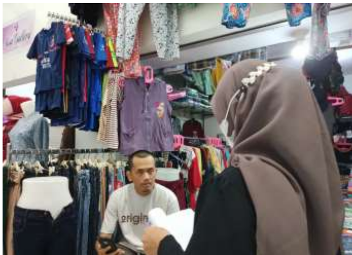
Mengisi Kuesioner Bersama Pedagang Pasar Bauntung Banjarbaru