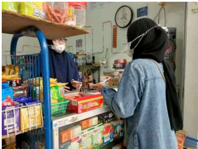
Mengisi Kuesioner Bersama Pedagang Pasar Bauntung Banjarbaru