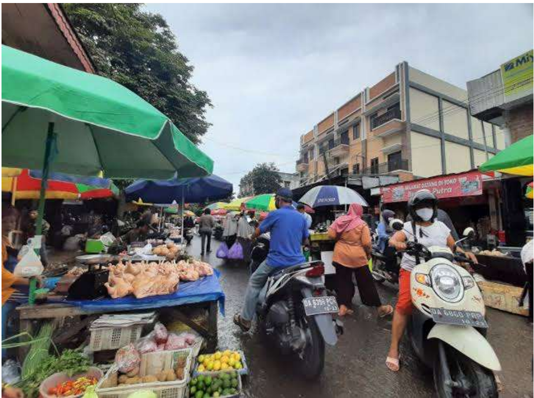
Kawasan Pasar Bauntung Banjarbaru Sebelum Relokasi