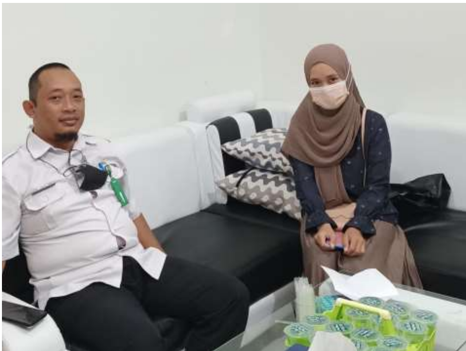
Wawancara Bersama Kepala UPT. Pasar Bauntung Banjarbaru