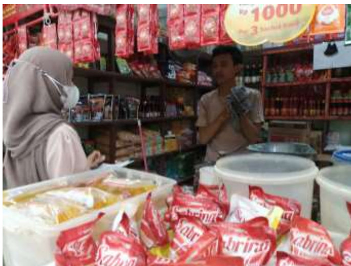
Mengisi Kuesioner Bersama Pedagang Pasar Bauntung Banjarbaru