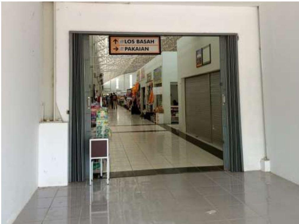
Kawasan Pasar Bauntung Banjarbaru Setelah Relokasi