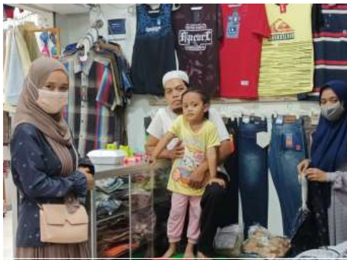
Wawancara Kepada Tiga Pedagang Untuk Data Awal