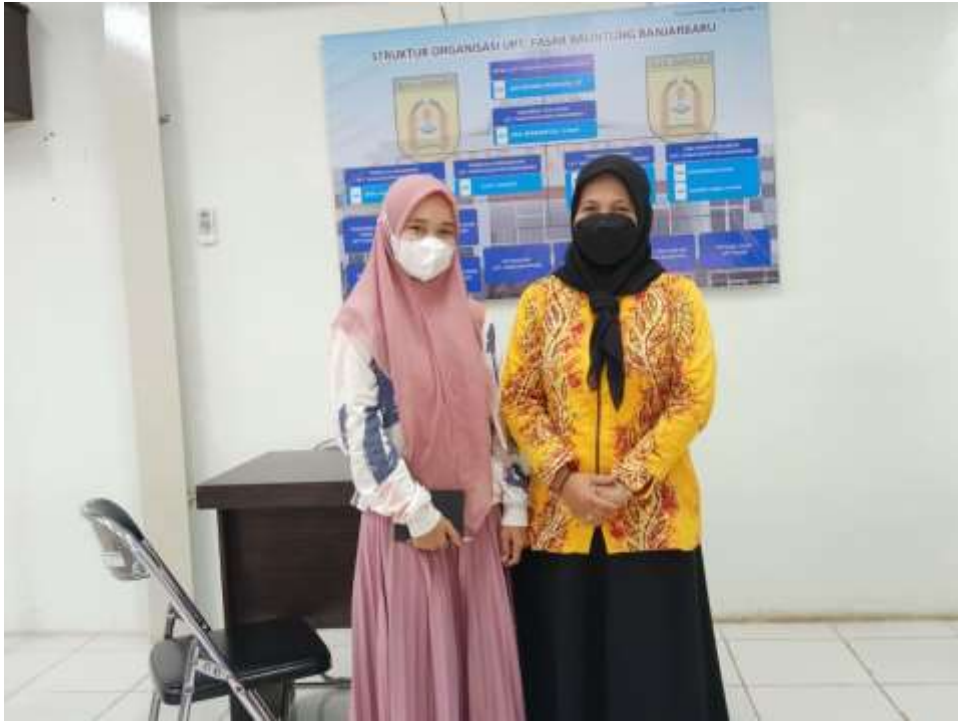
Observasi ke Kantor UPT. Pasar Bauntung Banjarbaru