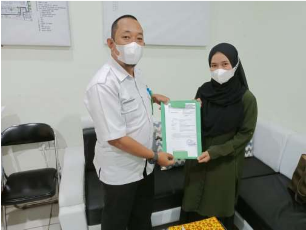
Penyerahan Surat Selesai Riset