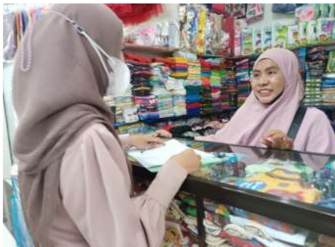
Mengisi Kuesioner Bersama Pedagang Pasar Bauntung Banjarbaru