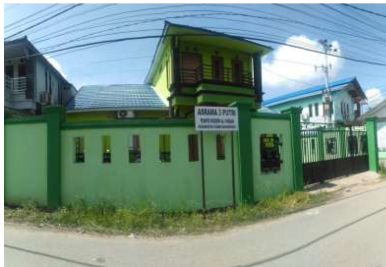
Observasi ke asrama 3 santriwati