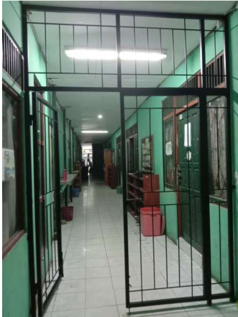
Observasi ke asrama santri