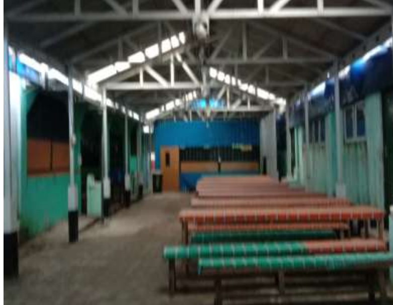
Observasi Tempat Makan Asrama