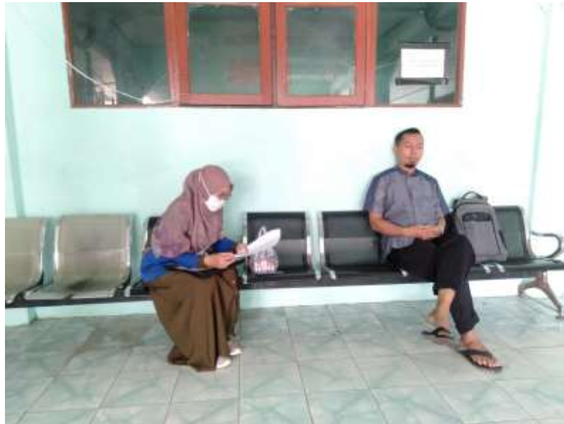
Wawancara dengan Kepala Asrama Pondok