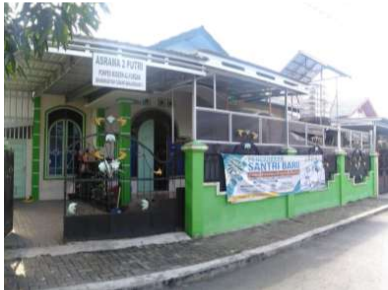
Observasi ke asrama 2 santriwati