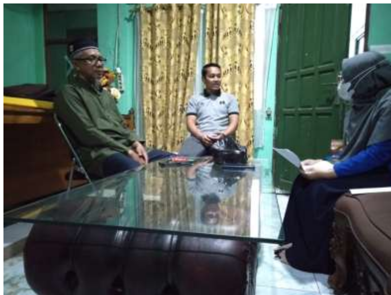
Wawancara dengan Pengurus Asrama Pondok