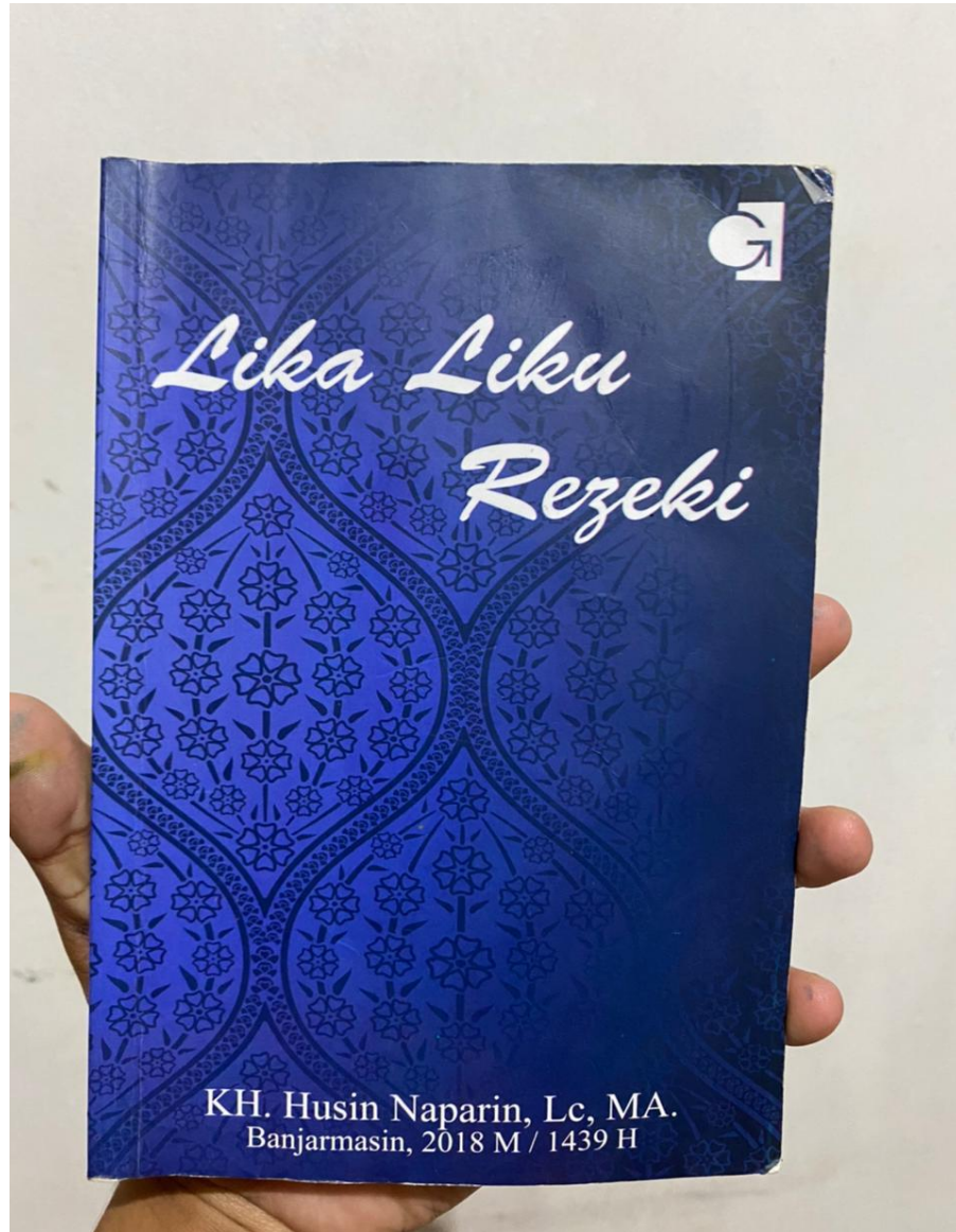
Gambar 1 Buku Lika Liku Rezeki