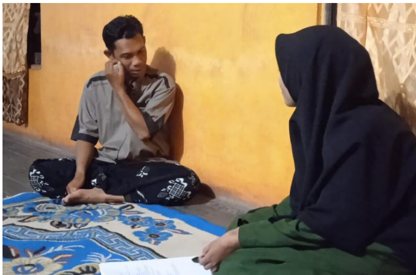
Wawancara dengan anggota pembiayaan usaha pertanian