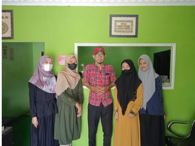
Foto bersama manajer, staf dan siswa magang di BMT Khairul Martapura cabang Sungai Rangas pada saat wawancara sekaligus observasi