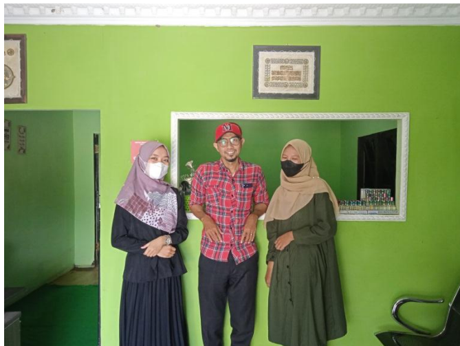
Foto bersama manajer dan staf BMT Khairul Martapura cabang Sungai Rangas pada saat wawancara sekaligus observasi