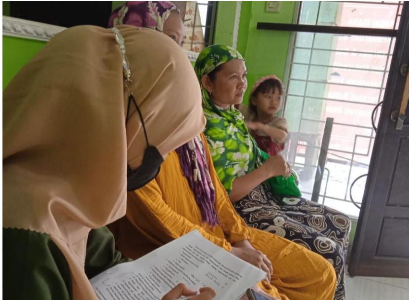
Wawancara dan observasi dengan anggota pembiayaan usaha pertanian