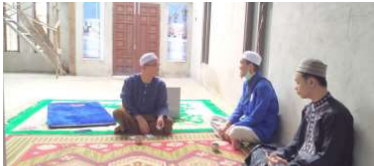
Foto bersama Responden