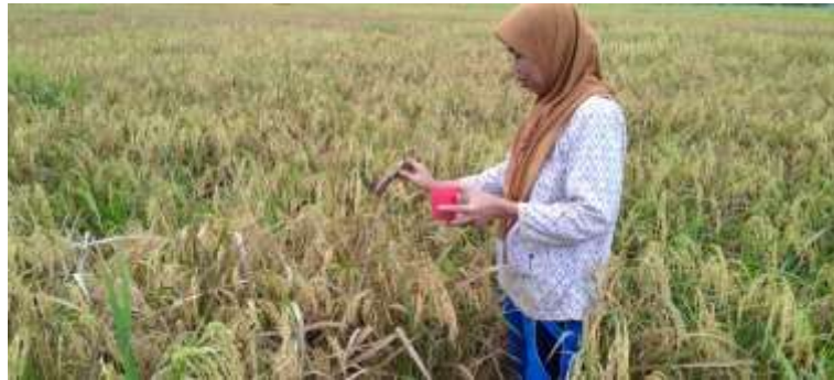
Foto Prosesi Tapung Tawar Banih