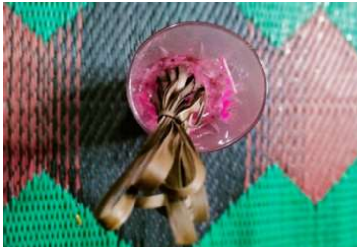
Foto Tapung Tawar