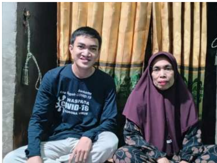
Foto bersama Responden