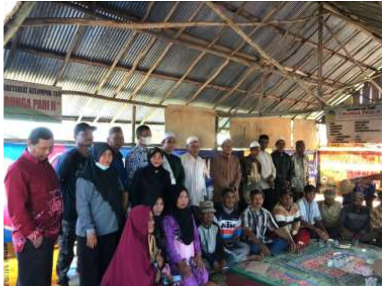
Acara Selamatan Memulai Mengatam Banih