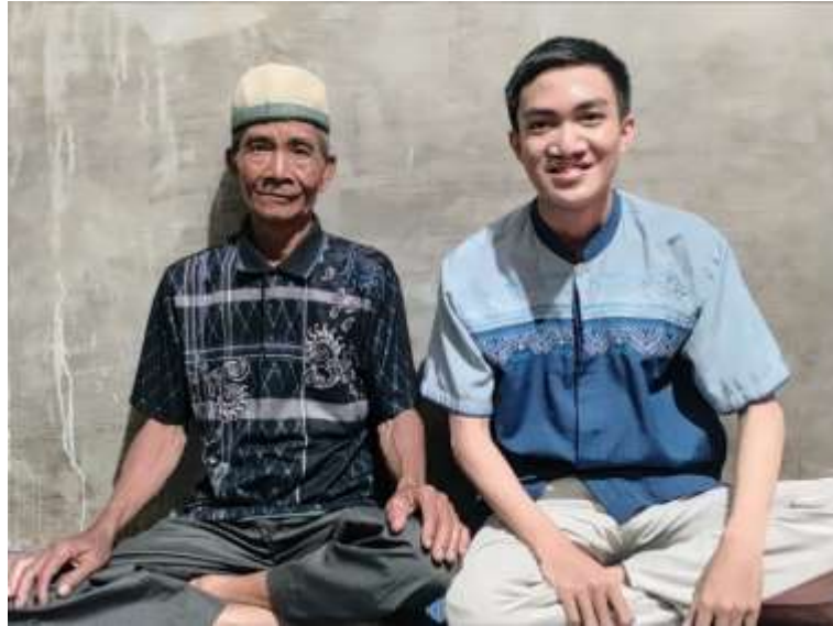
Foto bersama Responden