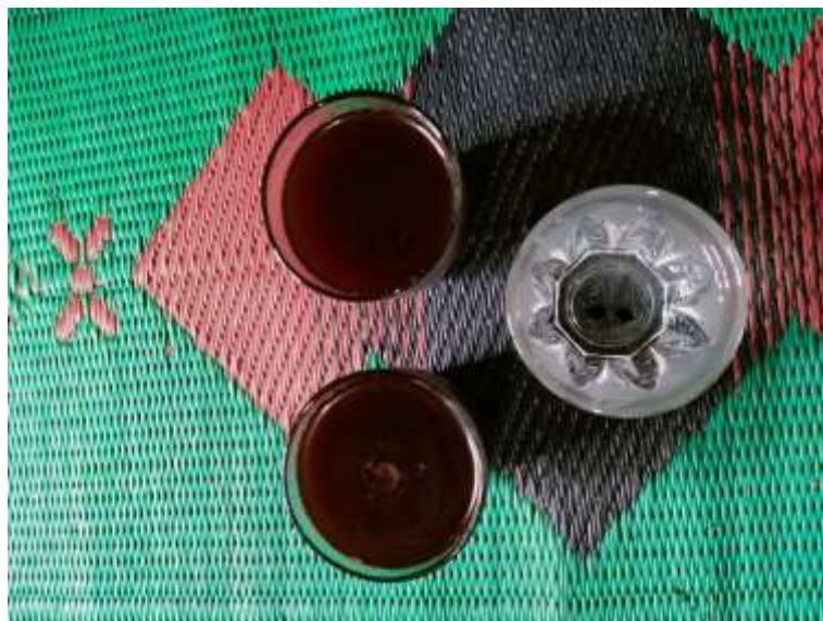
Kopi Manis, Kopi Pahit dan Air Putih