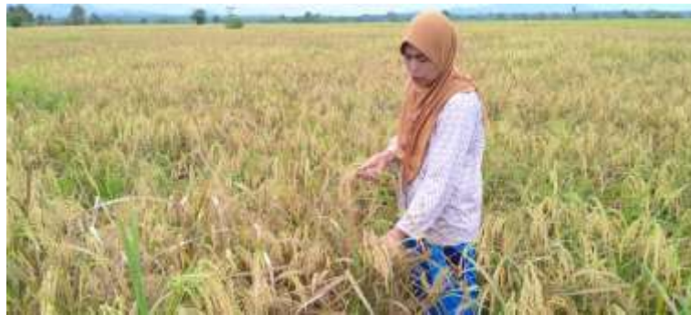
Foto Prosesi Memulai Mengatam Banih