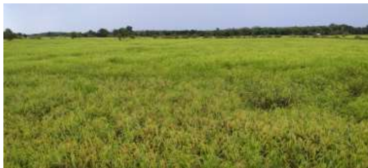
Foto Sawah di Desa Ujung Lama