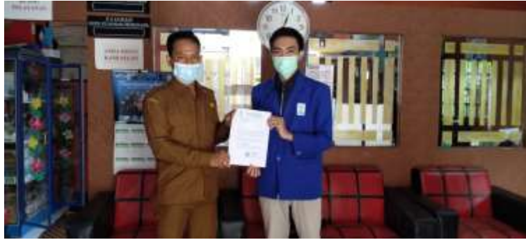
Foto bersama Kepala Desa Ujung Lama