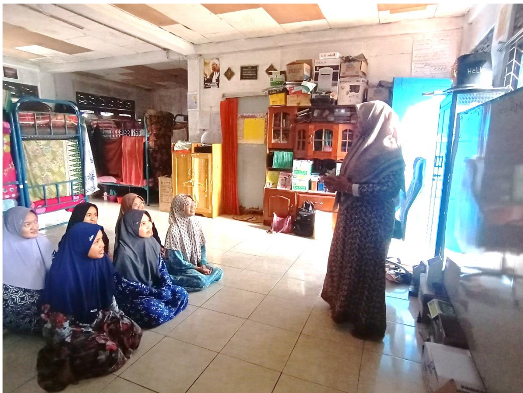
Gambar 4.9: Sesi Pemberian Nasihat kepada Santriwati

...kami juga sering mengingatkan santriwati misalkan apabila dirasa mereka kurang semangat untuk bersungguh-sungguh menuntut ilmu. Hal-hal yang memang termuat dalam kitab Hidayatul Muta'allim biasanya kami ingatkan sewaktu pembelajaran program... ” 73