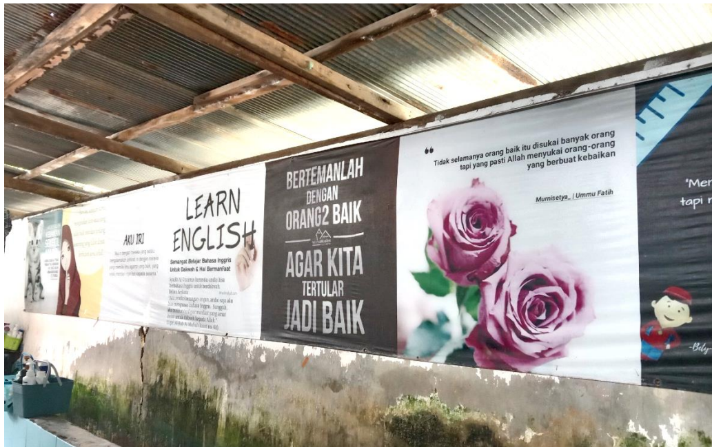
Gambar 4.10: Tempelan Poster di Luar Asrama