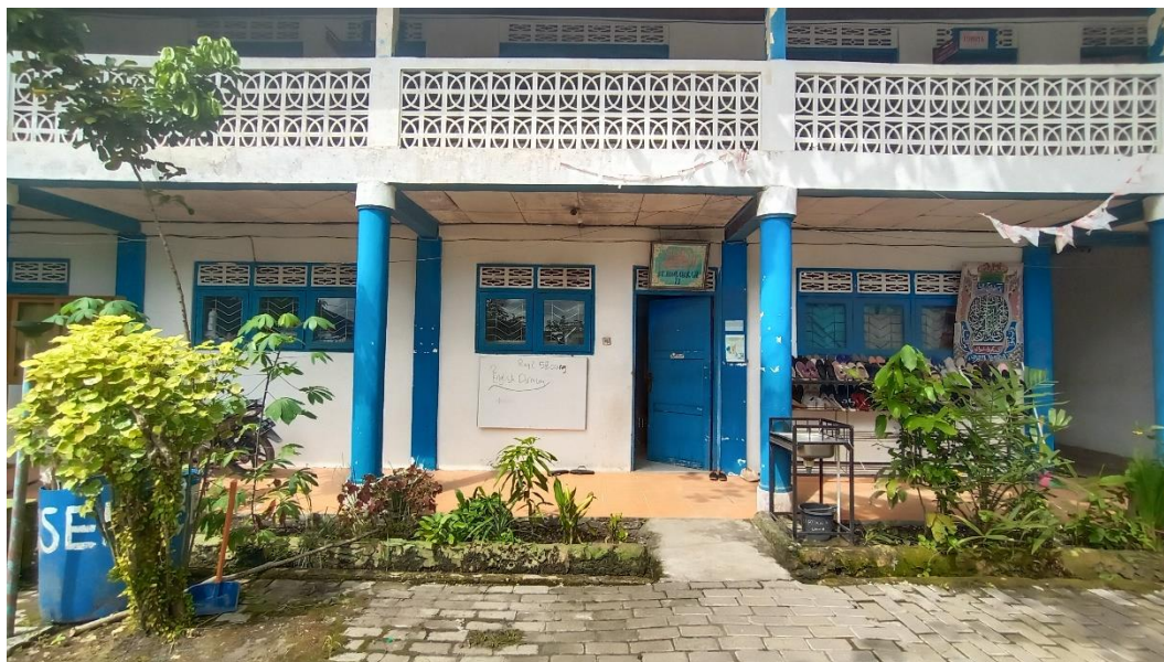
Gambar 4.2: Tempat Pelaksanaan Bimbingan Keagamaan (Asrama Ruqayyah 2)

Pembimbing asrama program pembelajaran, serta Santriwati Peserta Program Pembelajaran yang dibimbing.