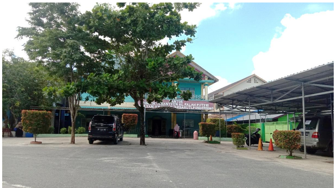
Gambar 4.1: Kantor Pondok Pesantren Al-Falah Puteri Banjarbaru

roda empat. Sekarang Pondok Pesantren Al-Falah sudah berada dilingkungan yang ramai dengan keadaan masyarakat dari sisi sosial yang cukup baik dan agamis yang membanggakan dan kehidupan politik yang cukup kondusif serta keadaan ekonomi masyarakat yang berada tahap pra-sejahtera. Pondok Pesantren Al-Falah berada dibawah naungan Yayasan Al-Falah dan tidak terikat pada organisasi apapun.