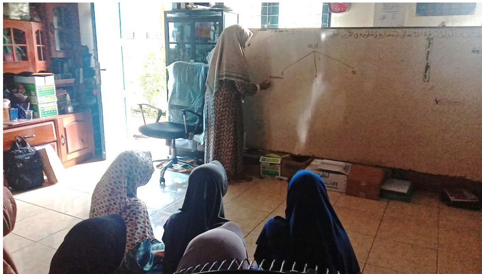
Gambar 4.6: Pelaksanaan Bimbingan di asrama

إِلَهِي لَسْتُ لِلْفِرْدَوْسِ أَهْلًا # وَلَا أَقْوَى عَلَى النَّارِ الْجَحِيمِ فَهَبْ لِي تَوْبَةً وَأَغْفِرْ ذُنُوبِي # فَإِنَّكَ غَافِرُ الذَّنْبِ الْعَظِيمِ