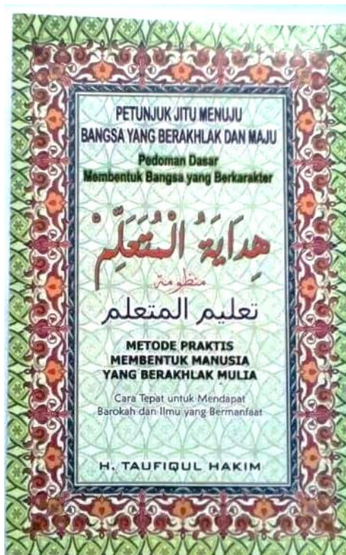
Gambar 4.7: Kitab Hidayatul Muta'allim

sudah lumayan banyak ditambah dengan aktivitas mereka yang padat.’ 61