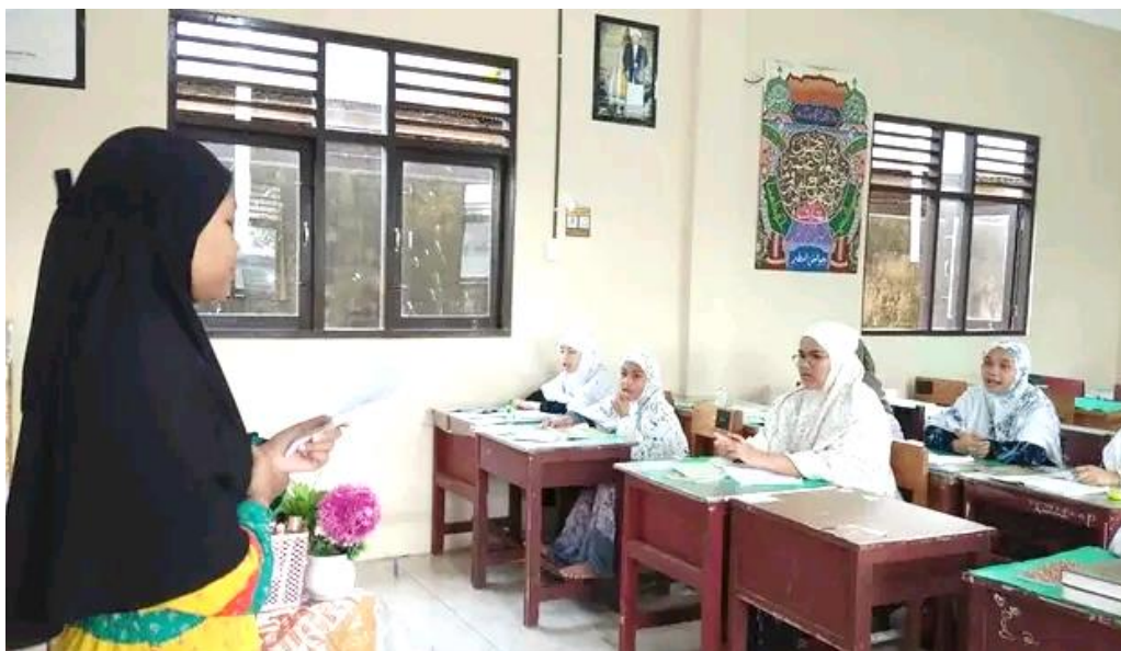
Gambar 4.4: Bimbingan Pra-Karantina

Mengenai kelas pra-karantina yang peneliti uraikan diatas sejalan dengan apa yang disampaikan Ustazah Hj. Munirah dalam wawancara berikut ini: