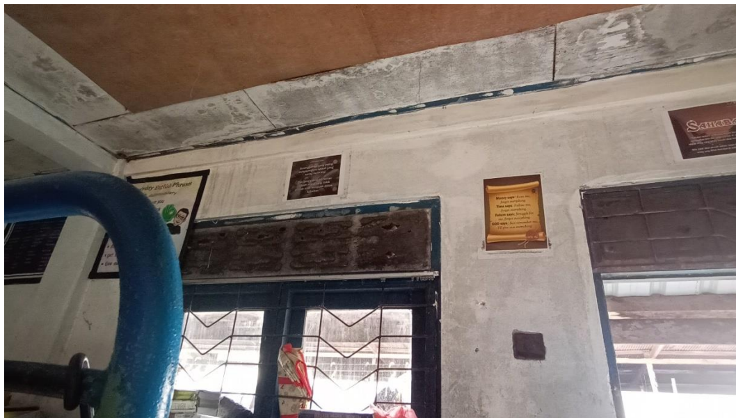
Gambar 4.11: Tempelan Poster di Dalam Asrama

Dalam penyampaian materi bimbingan keagamaan, Ustazah Hj. Munirah juga menggunakan media lisan dengan bentuk nasihat dan teguran. Penyampaian nasihat dan teguran tersebut langsung diberikan kepada santriwati dengan berbicara sebagaimana dijelaskan dalam metode bimbingan keagamaan sebelumnya.