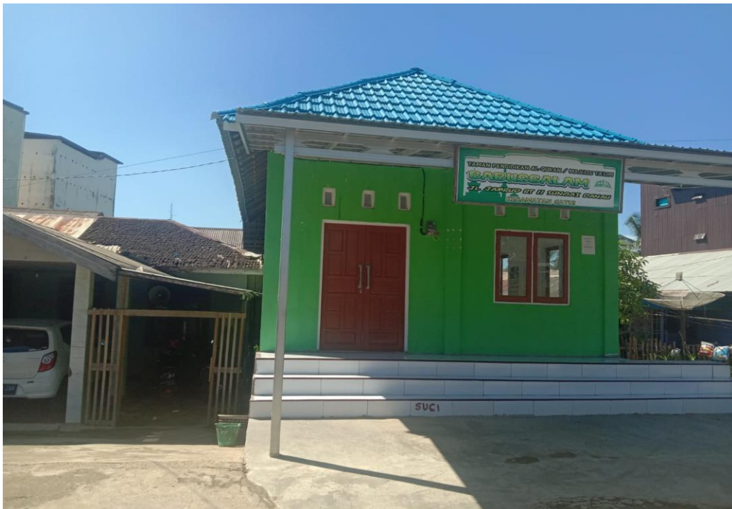
Aula Majelis Taklim Babussalam