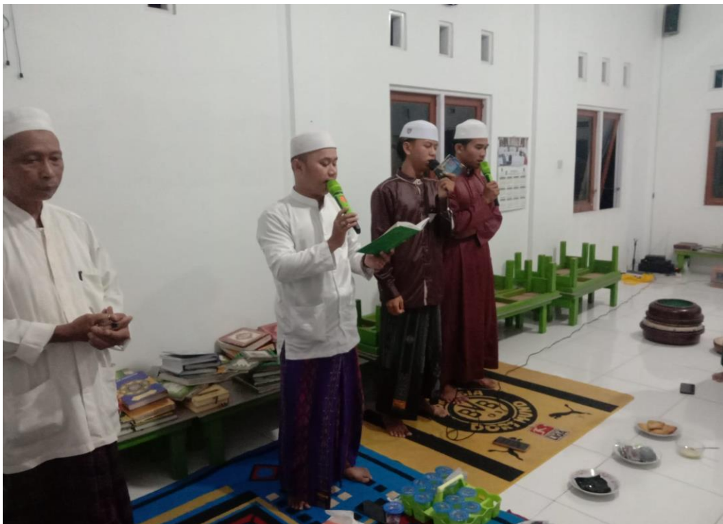
Pelaksanaan Maulid Habsyi di Aula majelis taklim Babussalam