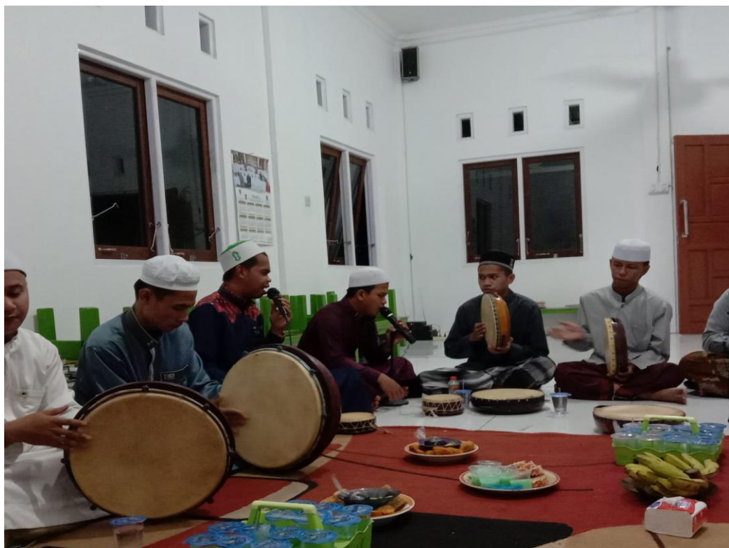
Pelaksanaan Maulid Habsyi di Aula majelis taklim Babussalam