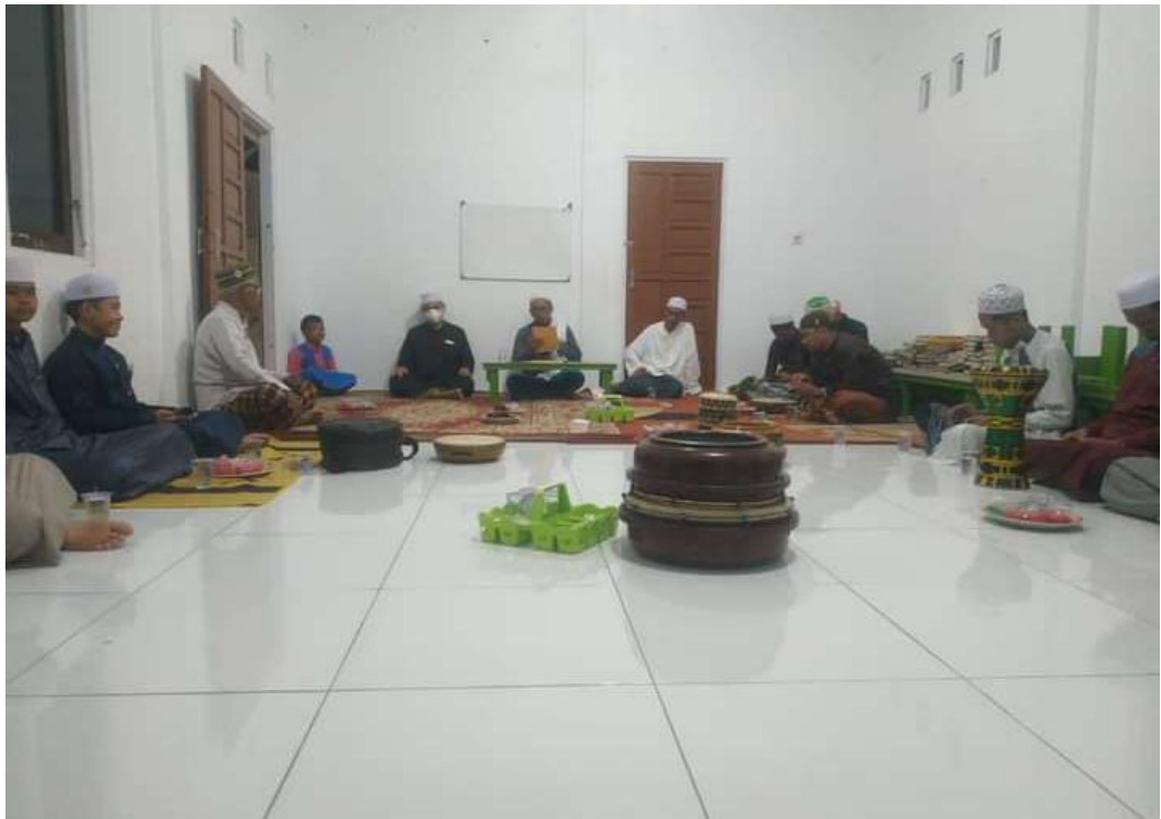
Pengajian di Aula majelis taklim Babussalam