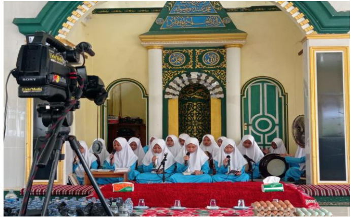
Gambar 0.4 Aktivitas Dakwah Pembacaan Burdan dan Habsyi