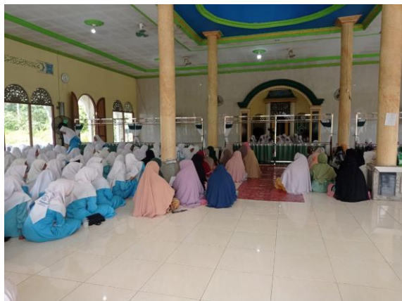
0.6 Aktivitas Dakwah Pembacaan Manaqib St. Khadijah R.a