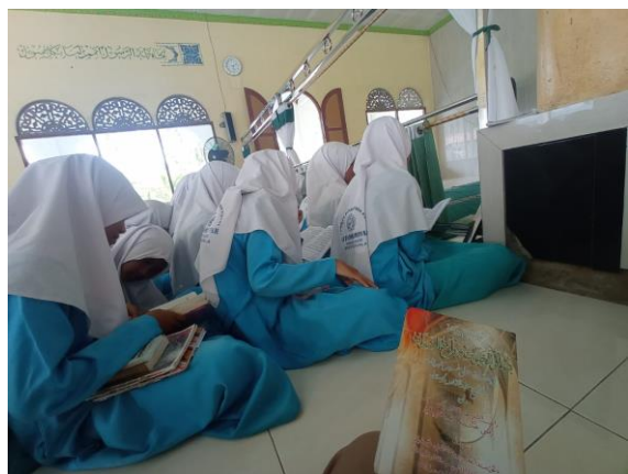
Gambar 0.5 Aktivitas Dakwah Pembacaan Sholawat Puncak