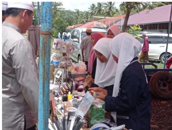
0.11 Aktivitas Dakwah Bazar Amal