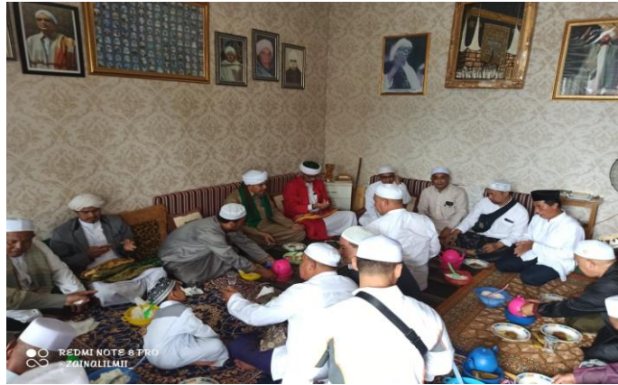
0.10 Aktivitas Dakwah Silaturrahmi