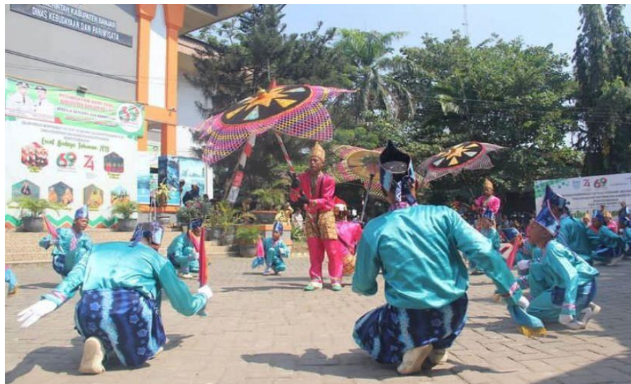
Gambar 4.15 Gerakan Tari Sinoman Hadrah

Gerakan tari dalam Sinoman Hadrah Qurrotul Uyyun merupakan gerakan yang diambil dari tarian japin arab dan japin melayu. Bisa juga ditambah sedikit gerakan kuntu yang merupakan kesenian khas Kalimantan.