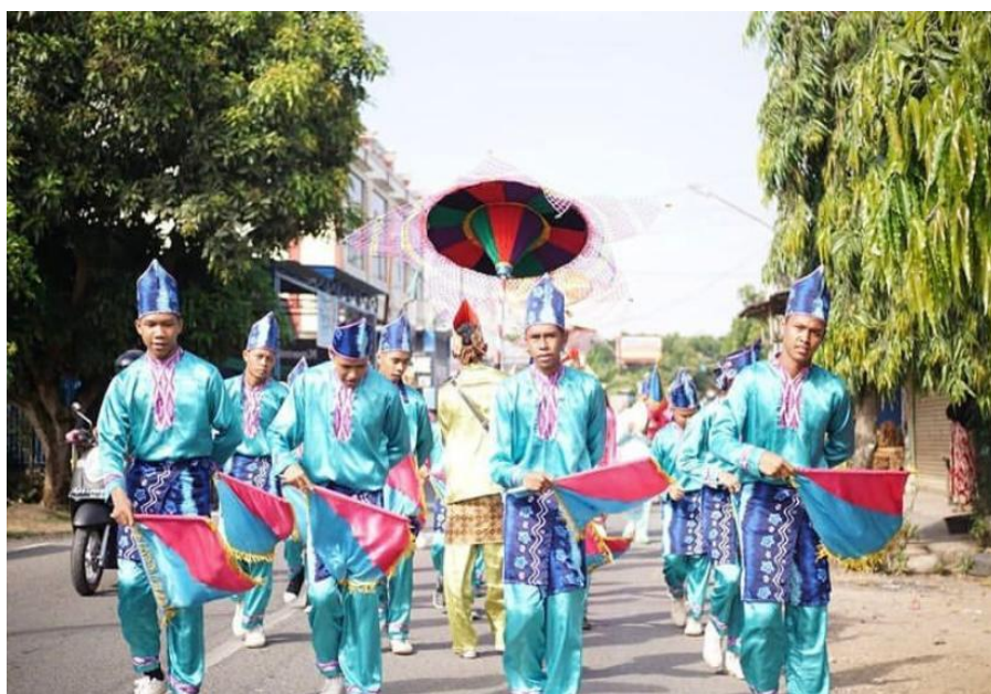
Gambar 4.14 Gerakan Masuk Menuju Lokasi Acara

Seluruh pemain Hadrah memasuki lokasi acara dengan wajah sumringah dan penuh semangat agar kiranya penonton yang menyaksikan turut berbahagia.