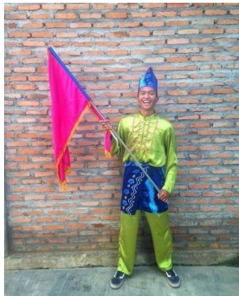
Gambar 4.9 Pilihan Kostum 2