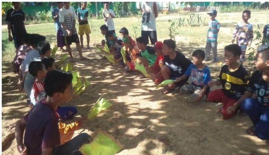
Gambar 4.7 Kegiatan Latihan

Indonesia. Dalam syair bahasa Indonesia bisa juga terdiri dari pantun-pantun yang dilagukan. Setiap syair yang dilantunkan berisi pujian-pujian kepada Allah SWT dan Rasulullah SAW, pesan-pesan kebaikan maupun nasihat-nasihat. 53