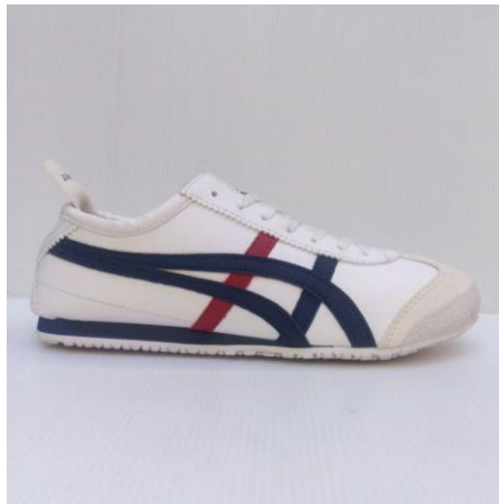
Gambar 4.12 Contoh Sepatu Kets

Dalam setiap penampilannya para anggota grup Sinoman Hadrah Qurrotul Uyyun selalu menggunakan sepatu agar kesannya terlihat lebih rapi dan menarik. Sepatu yang biasa digunakan ada 2 macam yaitu kets dan pantofel.