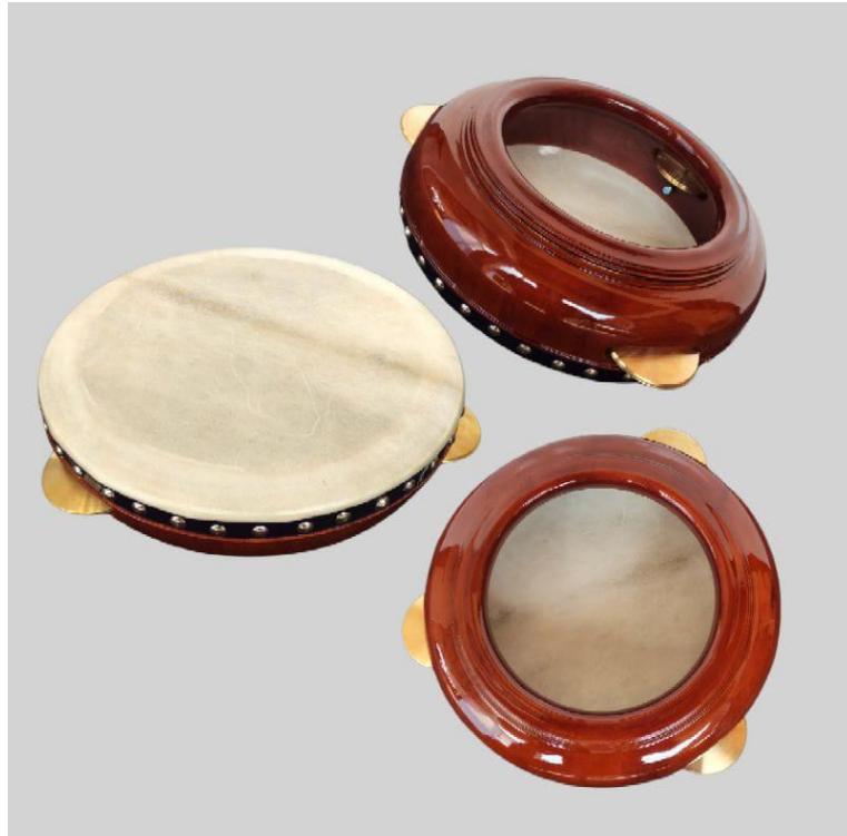
Gambar 4.3 Contoh rebbana/terbang