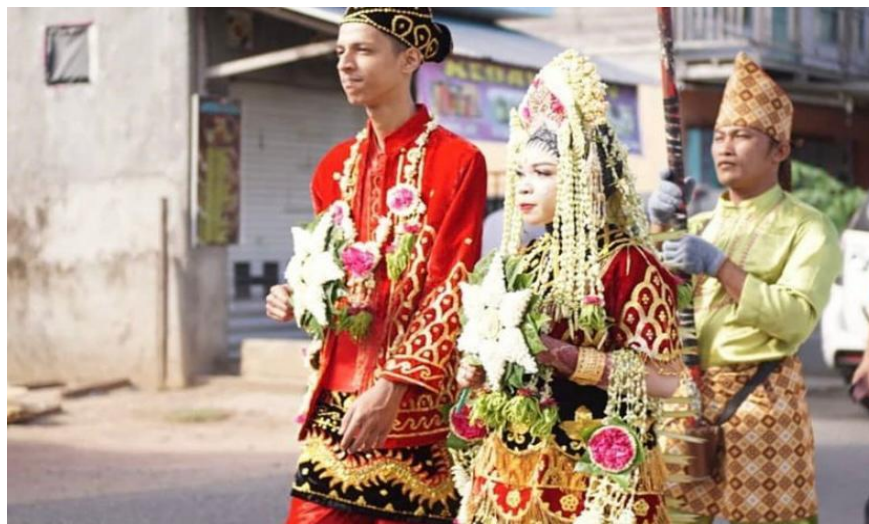
Gambar 4.16 Menggiring Pengantin di Acara Pernikahan

Untuk dapat melihat bagaimana penampilan Sinoman Hadrah Qurrotul Uyyun dari awal masuk hingga keluar dari lokasi acara tersebut dapat dilihat pada link Youtube berikut: https://youtu.be/bvVtrjnhgrE