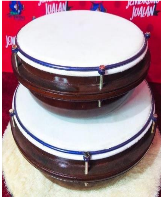
Gambar 4. 4 Contoh Babun/bass