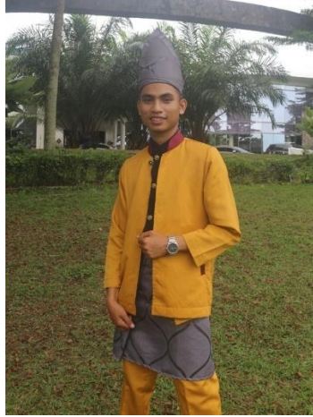
Gambar 4.8 Pilihan Kostum 1