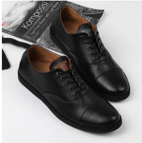
Gambar 4.13 Contoh Sepatu Pantofel

Persiapan dilanjutkan pada hari pelaksanaan yang dimulai dari persiapan keberangkatan yang biasanya menggunakan mobil bersama-sama untuk menuju lokasi acara.