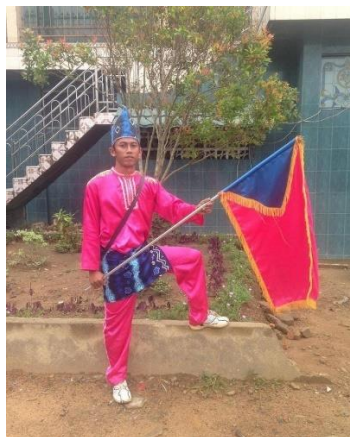
Gambar 4.10 Pilihan Kostum 3