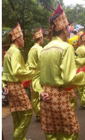
Gambar 4.11 Pilihan Kostum 4