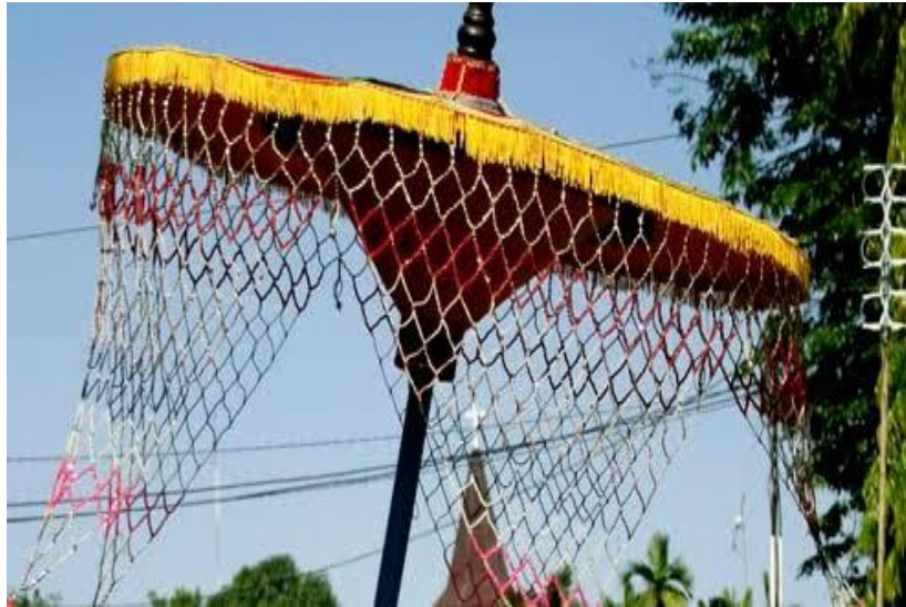
Gambar 4. 5 Contoh Payung Ubur-ubur