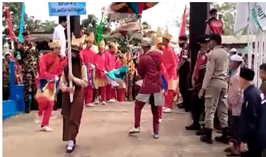
Gambar 4.17 Menggiring Peserta MTQ