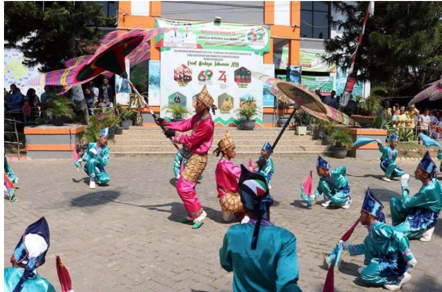
Gambar 4.18 Penampilan Pada Festival Budaya Banjar