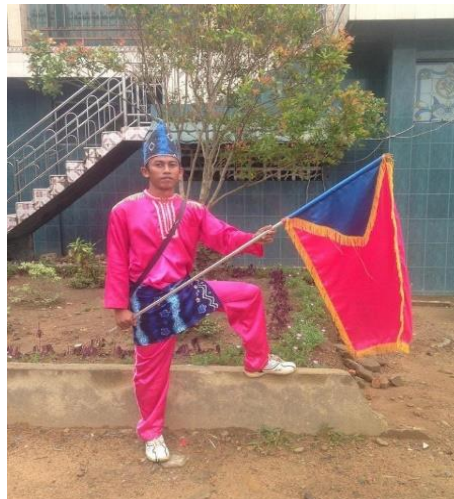
Gambar 4. 6 Contoh Bendera/bandul

Semua pemain Hadrah ini memegang bendera terkecuali pemain musik dan pembawa payung.