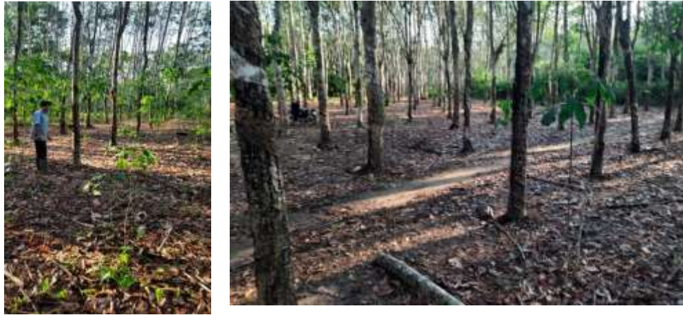
Gambar 4. 2. Gambaran Perkebunan Karet di Desa Tampang Kecamatan Lampihong