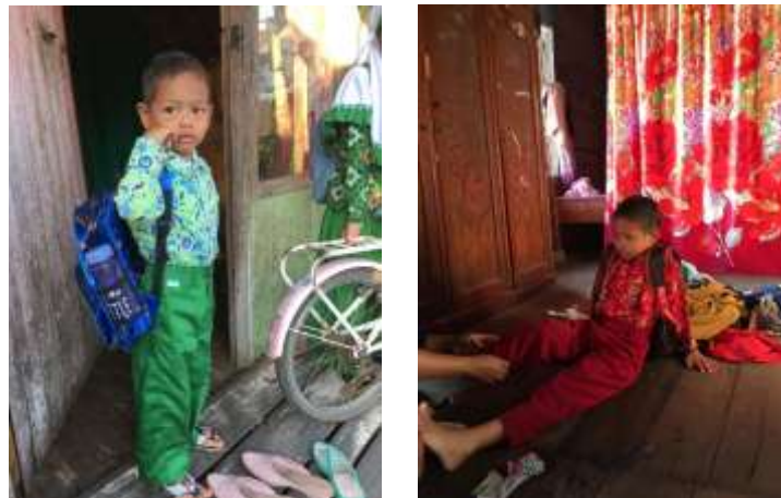
Gambar 4. 5. Gambaran Kesejahteraan Ekonomi Masyarakat Desa Tampang Kecamatan Lampihong dilihat dari Partisipasi pada Pendidikan Formal

Hasil dokumentasi di atas membuktikan bahwa di Desa Tampang Kecamatan Lampihong Kabupaten Balangan tingkat kesejahteraan masyarakat memang tergolong tergolong Keluarga Sejahtera I (KS I), sebab pada umumnya anggota keluarga makan dua kali sehari atau lebih, anggota keluarga memiliki pakaian yang berbeda untuk di rumah, bekerja/sekolah dan bepergian, rumah yang ditempati keluarga mempunyai atap, lantai dan dinding yang baik, bila ada anggota keluarga sakit dibawa ke sarana kesehatan, bila pasangan usia