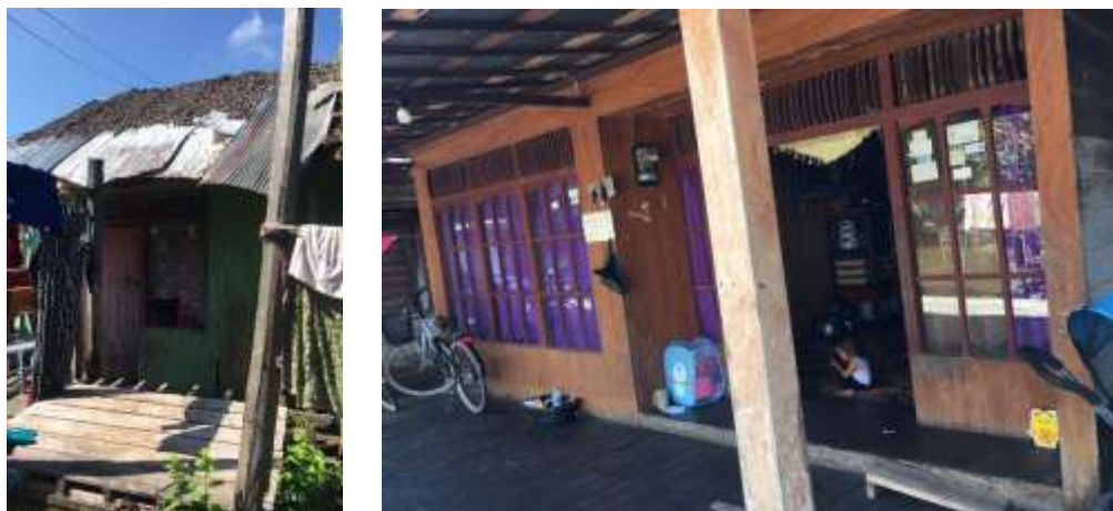
Gambar 4. 3. Gambaran Kesejahteraan Ekonomi Masyarakat Desa Tampang Kecamatan Lampihong dilihat dari Fisik Bangunan Rumah