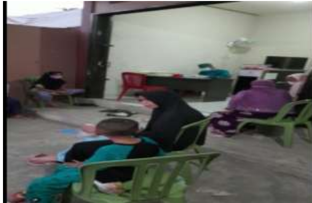
Gambar 4. 4. Gambaran Kesejahteraan Ekonomi Masyarakat Desa Tampang Kecamatan Lampihong dilihat dari Ketersediaan Pelayanan Kesehatan