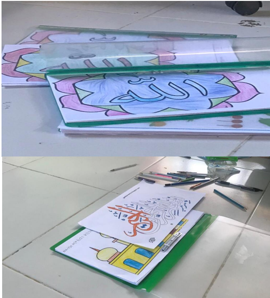
Gambar 1.8 Senam Setiap Hari Jum'at