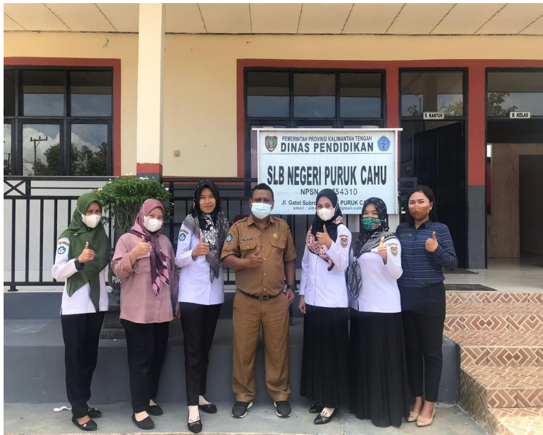
Gambar 1.5 Siswi kelas 4 dan Siswa kelas 3

Menuliskan Huruf Hijiyah yang diajarkan oleh Ibu Sobiyatun