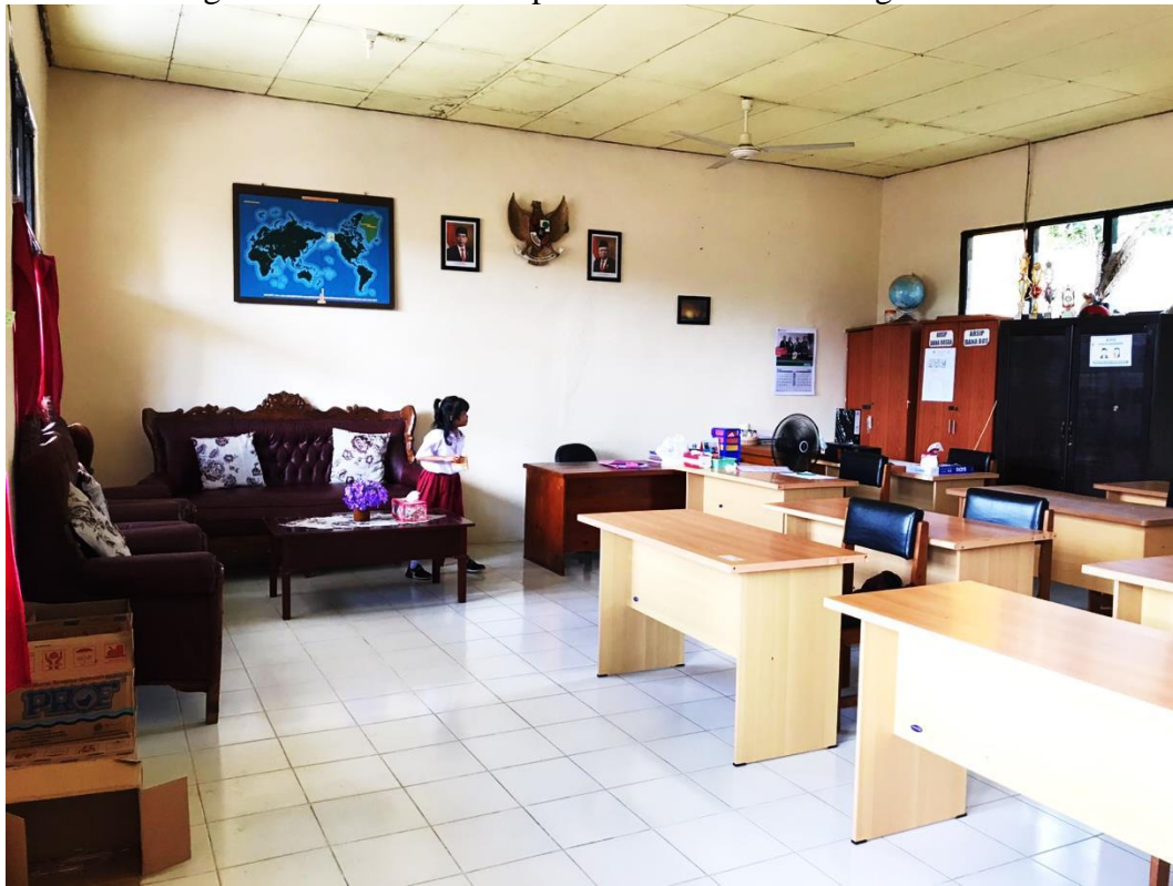
Gambar 1.3 Nama Guru-Guru yang Ada di SLB Negeri Puruk Cahu