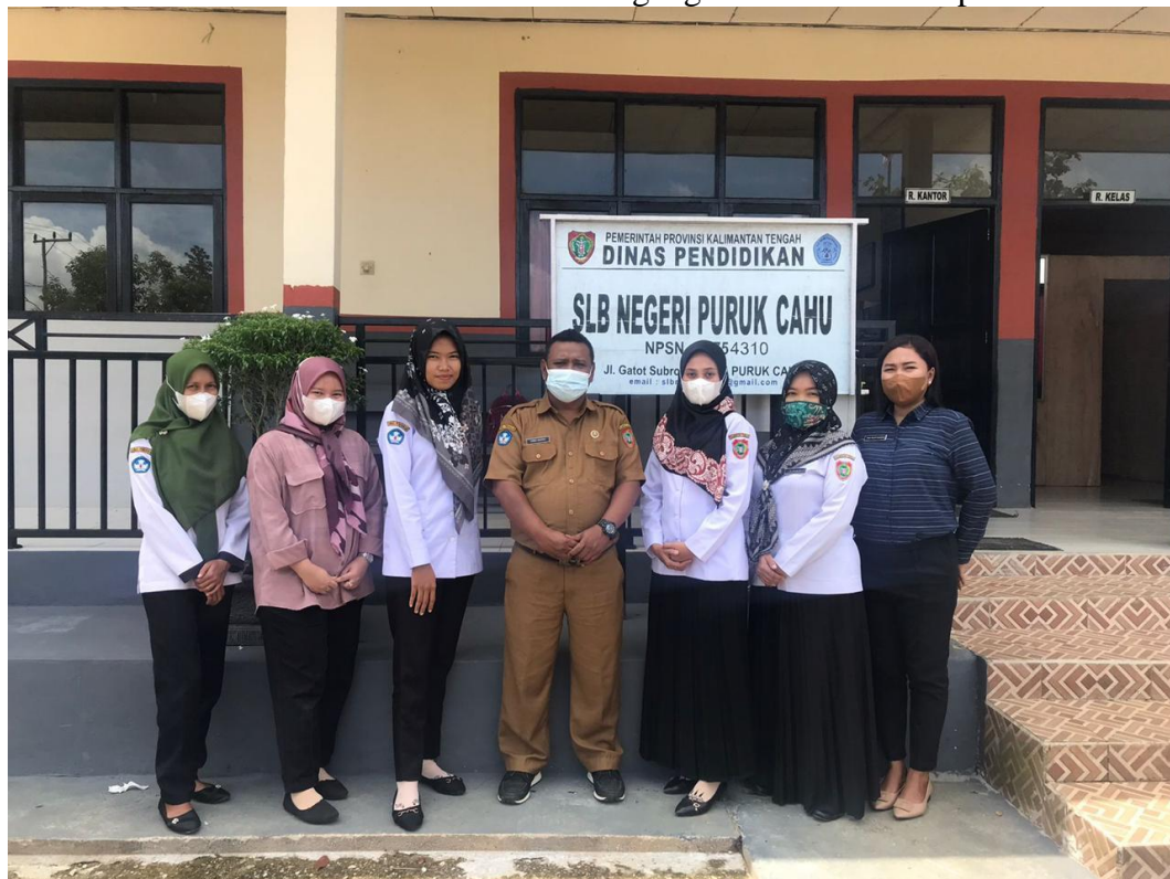
Foto Bersama Guru-Guru Pembimbing Agama Islam dan Kepala Sekolah