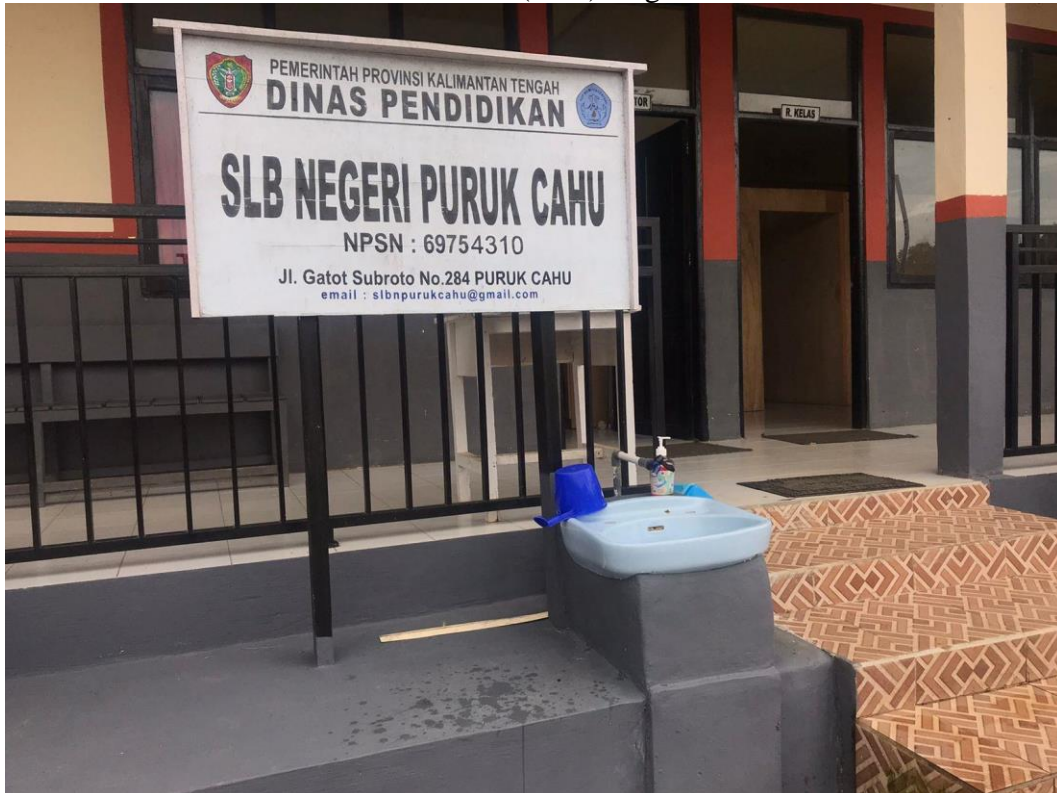
Gambar 1.1 Sekolah Luar Biasa (SLB) Negeri Puruk Cahu