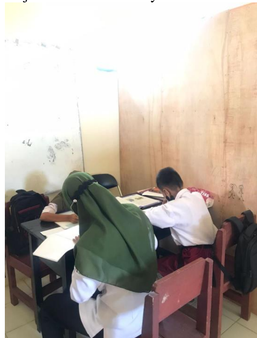
Gambar1.6 Siswa kelas 3