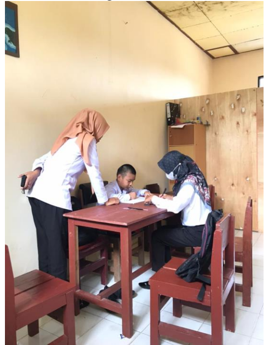
Gambar 1.7 Mewarnai Kaligrafi dan Menjawab Pertanyaan