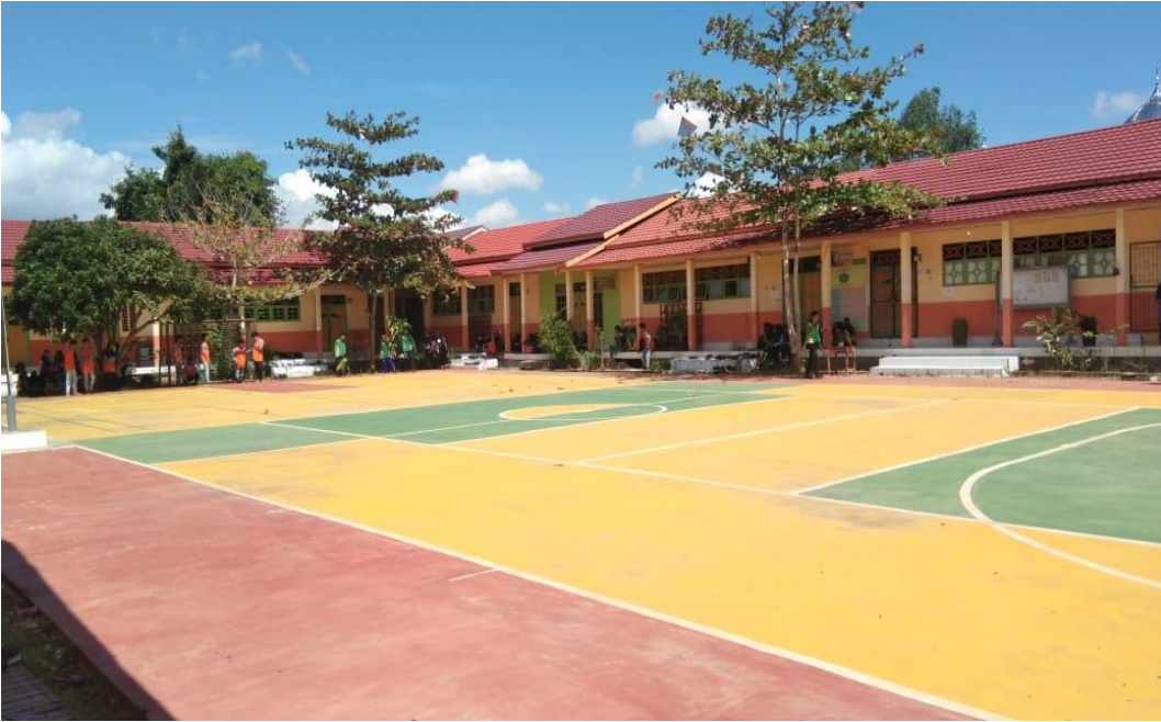
Lampiran 3. Gambar Sekolah