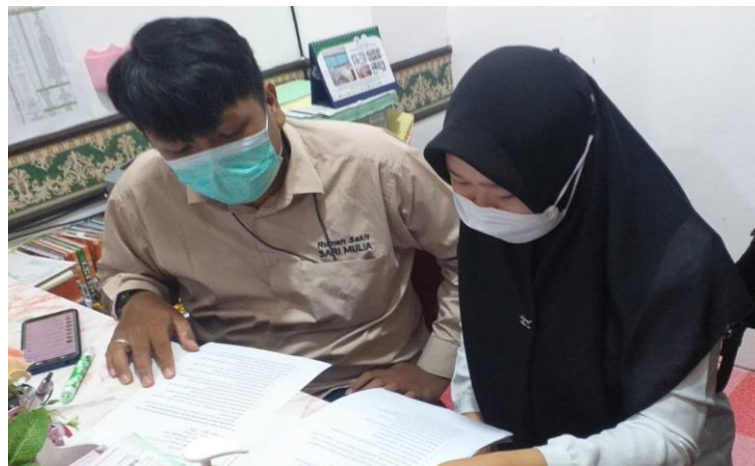
Wawancara kepada Administrator 2 klaim BPJS Rumah Sakit Sari Mulia Senin, 06 Juni 2022