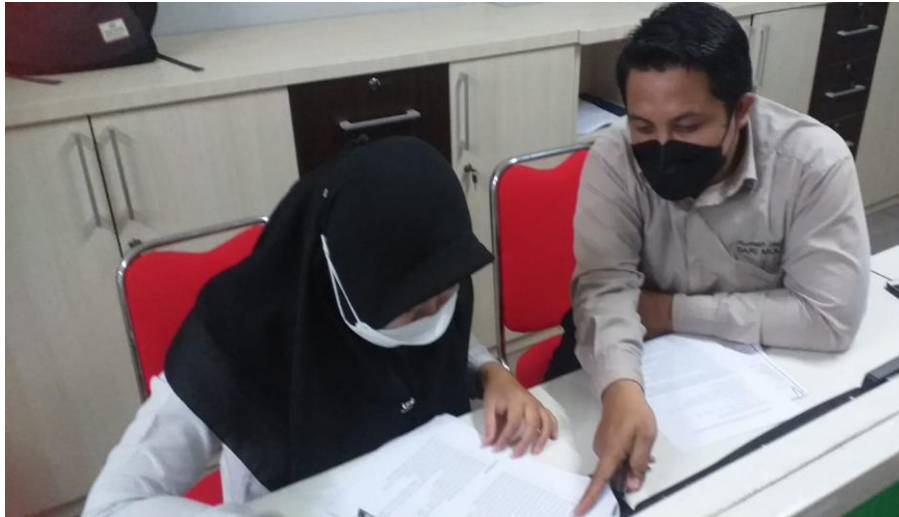
Wawancara kepada Administrator 1 klaim BPJS Rumah Sakit Sari Mulia Senin, 06 Juni 2022