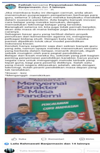
Gambar 4.11 Gunakan isi pesan yang beragam

“Kalau mengunggah kami memang beragam dari informasi mengenai aktivitas, program-program perpustakaan sekolah, artikel atau karya tulis, kami pun juga mengunggah informasi yang di adakan di sekolah.” 16