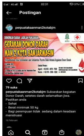
Gambar 4.5 Mempublikasikan kegiatan

“Iya, karena semua orang melihat informasi di Instagram perpustakaan. Dan bisa melihat acara apa saja yang telah di adakan di perpustakaan dan acara apa yang akan di adakan perpustakaan.” 12