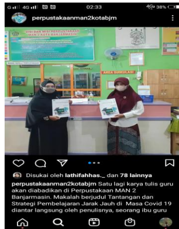
Gambar 4.6 Melibatkan proses

Dengan adanya publikasi kegiatan dan melibatkan proses pada media sosial Instagram maka dari itu media sosial Facebook dengan kegiatan meng- upload menurut admin media sosial menyatakan: