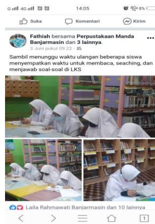
Gambar 4.10 Menjadi sumber informasi

“Dengan menggunggah informasi ke dalam media sosial Facebook , Perpustakaan Madrasah Aliyah Negeri 2 Kota Banjarmasin mengunggah kegiatan, aktivitas, program-program, gambar yang bernilai positif.”