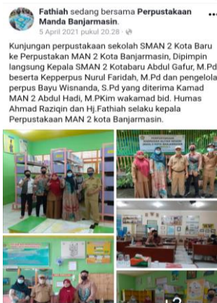
Gambar 4.8 Posting singkat dan padat