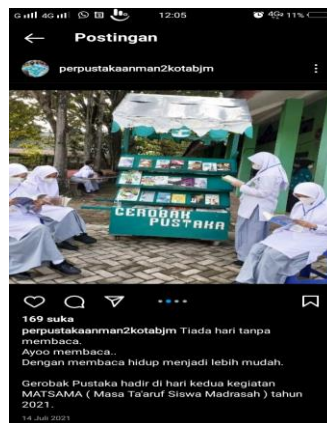
Gambar 4.4 menunjukkan koleksi

“Dengan mengunggah foto yang menunjukkan sekeliling dan koleksi perpustakaan, perpustakaan telah menunjukkan produk perpustakaan, hal ini bertujuan untuk memberikan gambaran kepada pengguna tentang perpustakaan. Dengan demikian diharapkan pengguna akan tertarik untuk datang ke Perpustakaan Madrasah Aliyah Negeri 2 Kota Banjarmasin.” 11