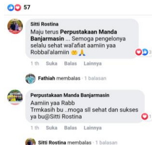
Gambar 4.9 Menciptakan dialog dua arah

“ Facebook Perpustakaan Madrasah Aliyah Negeri 2 Kota Banjarmasin ini memberikan fitur komentar untuk berkomunikasi dengan pengikut akun.”