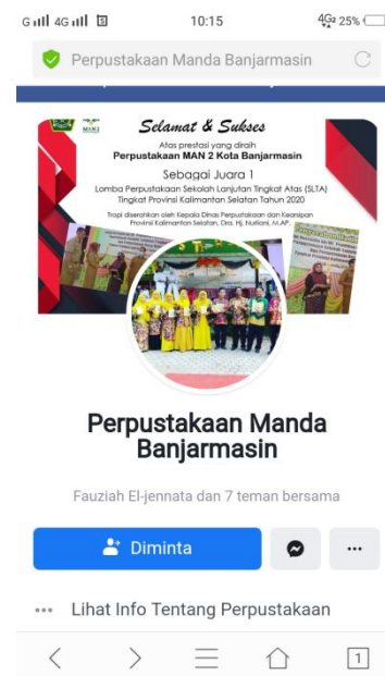
Gambar 4.2 Profil akun Facebook perpustakaan MAN 2 kota Banjarmasin

Agar dapat memudahkan siswa pihak sekolah ataupun dari luar sekolah untuk mencari media sosial perpustakaan Madrasah Aliyah Negeri 2 Kota Banjarmasin dapat di lihat Instagram @perpustakaanman2kotabjm dan Facebook @Perpustakaan