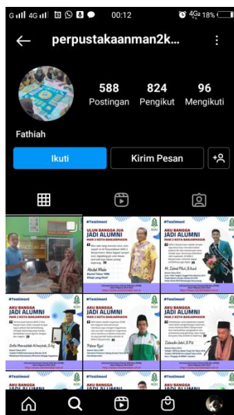
Gambar 4.1 Profil akun Instagram perpustakaan MAN 2 kota Banjarmasin

Pemanfaatan media sosial di Perpustakaan Madrasah Aliyah Negeri 2 Kota Banjarmasin telah dilaksanakan pada tahun 2019. Media sosial yang digunakan untuk sarana promosi menggunakan aplikasi Instagram dan Facebook . Media sosial Perpustakaan Madrasah Aliyah Negeri 2 Kota Banjarmasin ini pertama kali dibuat pada akun Instagram pada 4 maret 2019 dan akun Facebook pada 12 mei 2020.