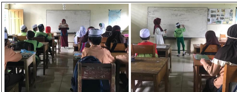
Gambar 4.3 Dokumentasi Kegiatan 2

Secara keseluruhan pembelajaran kelas kontrol dan kelas eksperimen hanya berbeda pada penggunaan media gambar. Kelas eksperimen menggunakan media gambar dan kelas kontrol tidak menggunakan gambar sedangkan langkah dan tahapan pembelajarannya tidak berbeda.