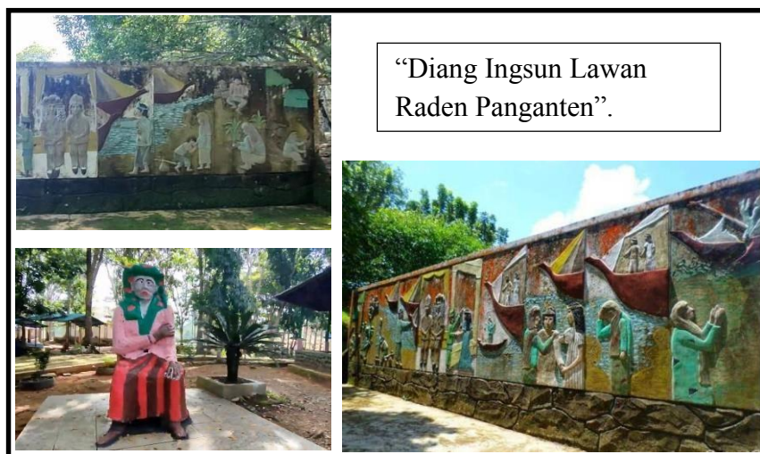
Gambar 4.2 Contoh Media Gambar