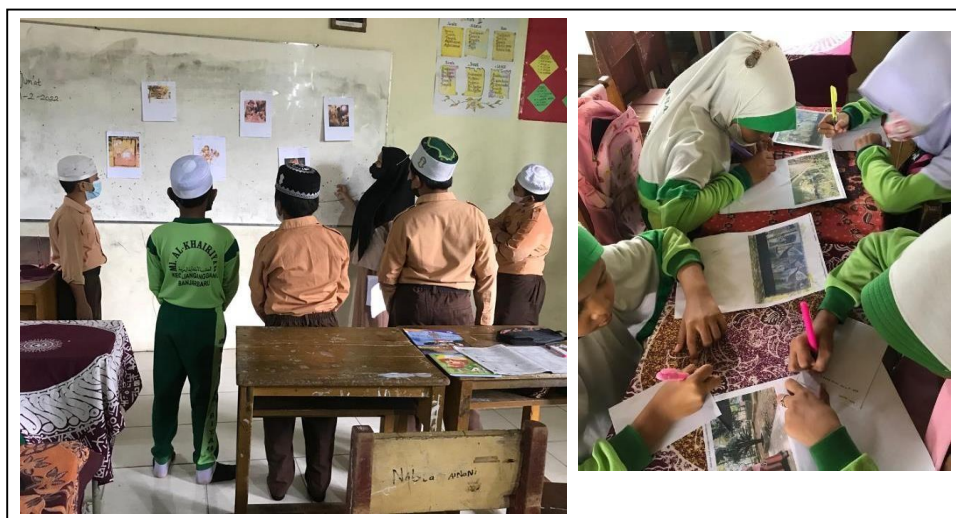
Gambar 4.1 Dokumentasi Kegiatan 1

Guru memberikan beberapa pertanyaan dan mengajak siswa untuk berinteraksi selama pembelajaran berlangsung. Hal ini bertujuan agar tercipta pembelajaran yang tidak monoton dan meningkatkan pemahaman siswa.