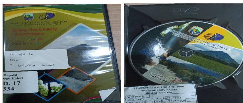
Gambar 4.2 Koleksi Deposit Kaset dan Nomor Pangung

Koleksi deposit di Dinas Perpustakaan dan Kearsipan Provinsi Kalimantan Selatan sudah melaksanakan menyesuaikan dengan pedoman Perpustakaan Nasional RI. Hal tersebut dapat dilihat pada gambar dibawah ini bahwa koleksi deposit yang berbentuk kaset dengan kode khusus RF yang telah mengikuti UUD No. 4 Tahun 1990 dan Perpustakaan Nasional RI.