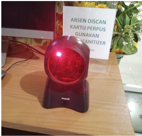
Gambar Perangkat Keras Sistem Otomasi Perpustakaan