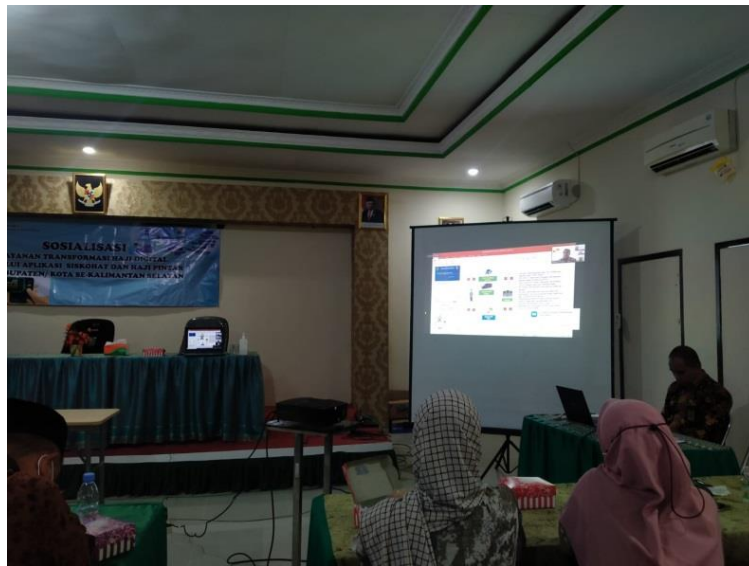
Gambar 4. 2 Penyampaian Materi Melalui Aplikasi Zoom di Kankemenag Tabalong

Dalam sosialisasi ini, peserta diperbolehkan untuk bertanya jawab dan berdiskusi pada sesi dialog antar narasumber dan peserta guna memberikan penjelasan lebih lanjut jika ada yang belum dimengerti. Ragam pertanyaan diajukan seperti tentang kepastian rencana keberangkatan haji, kasus-kasus pembatalan calon jemaah haji, dklarifikasi informasi palsu ( hoax ) perihal penggunaan dana haji yang beredar di tengah masyarakat. Narasumber menjawab secara bergantian sesuai jenis pertanyaan yang diajukan.