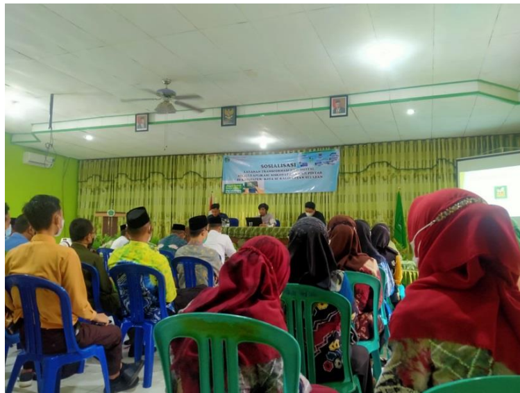
Gambar 4. 1 Pemaparan Materi Aplikasi Haji Pintar Oleh Narasumber di Kankemenag Hulu Sungai Selatan

Pada sosialisasi ini, narasumber memberikan penjelasan dan contoh melalui presentasi power point disertai dialog antar narasumber dan peserta. Narasumber menampilkan video tutorial menggunakan aplikasi Haji Pintar sehingga peserta dapat mempraktikkan langsung di tempat. Sebelumnya narasumber meminta pada peserta untuk meng- install aplikasi Haji Pintar yang tersedia di Play Store gawai masing-masing.