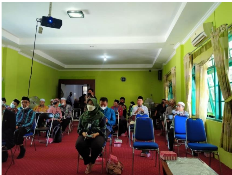
Gambar 4. 3 Diskusi Peserta dan Narasumber di Kankemenag Banjarbaru

Adapun kendala yang penulis temukan selama kegiatan sosialisasi berlangsung antara lain :