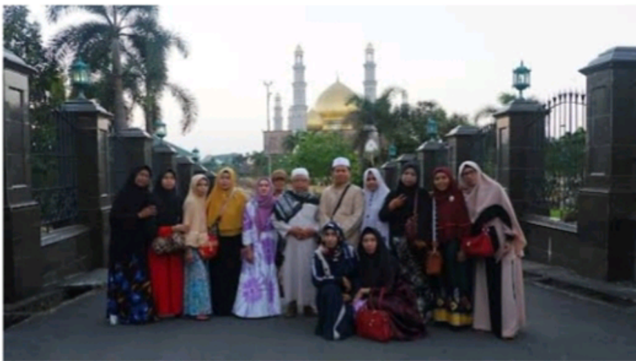
(Dokumentasi pelaksanaan dan kegiatan dari PT. ALBIS NUSA WISATA CABANG KELUA )