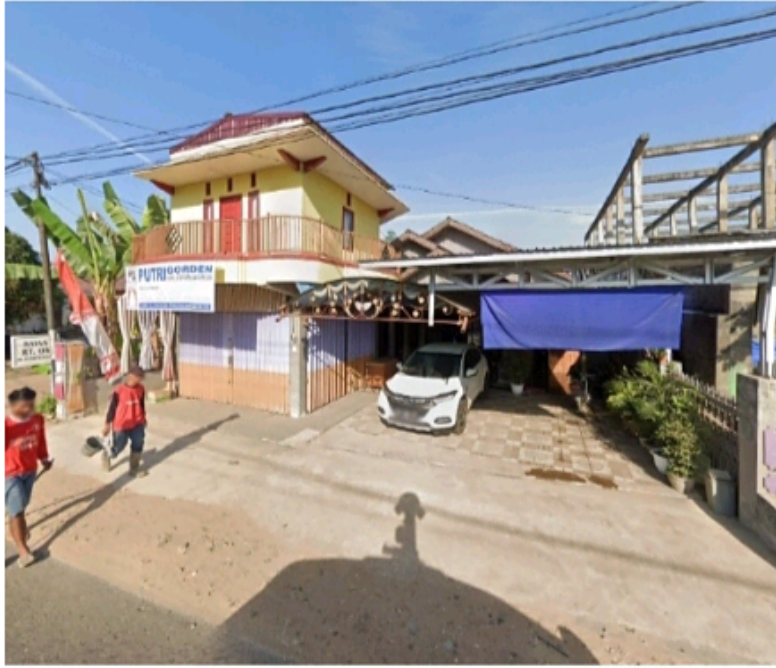
Lokasi travel tampak depan