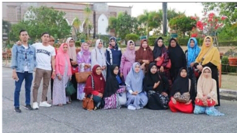
(Dokumentasi pelaksanaan dan kegiatan dari PT. ALBIS NUSA WISATA CABANG KELUA )