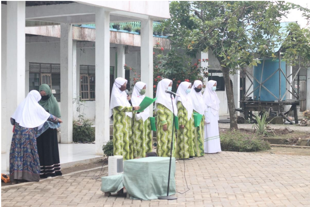
GAMBAR DOKUMENTASI 9. Foto kegiatan lomba 17 Agustus di Pondok Pesantren Al-Hikmah Putri.