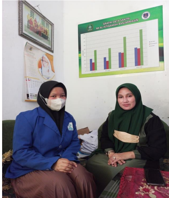
FOTO PELAKSANAAN WAWANCARA BERSAMA KETUA YAYASAN DAN GURU PONDOK PESANTREN AL ISTIQAMAH