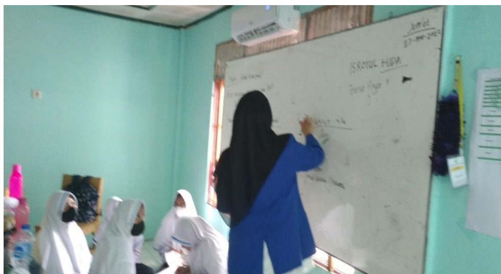
Gambar 4.2. Tahapan Read Guru membagikan Bahan Bacaan Serta Menyajikan Materi yang Dipelajari Kepada Siswa dikelas VIII D

pada data tunggal, menjelaskan cara mengubah data dalam bentuk grafik dan memberikan beberapa contoh mengenai penggunaan bentuk umum mean, median dan modus data tunggal dan gambar grafik