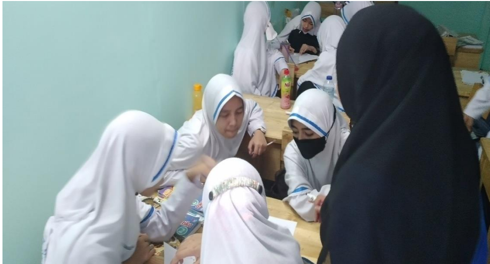
Gambar 4.3. Tahapan Explore Guru Memfasilitasi Siswa Diskusi Kelompok dikelas VIII D