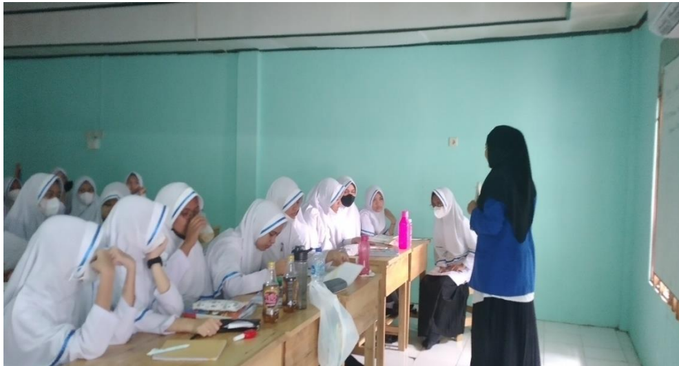
Gambar 4.1. Tahapan Gear Up Guru Menyiapkan Mental Siswa dikelas VIII D

tersebut berkaitan atau bermanfaat bagi kehidupan sehari-hari misalnya ketika kita ingin menghitung rata – rata berat badan teman-teman dalam satu kelas, maka kita bisa menggunakan rumus mean / rata – rata data tunggal. Begitu juga dengan materi median dan modus.