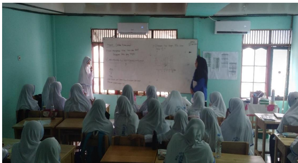
Gambar 4.5. Tahapan Tell Siswa Mengkomunikasi Hasil Diskusi Kelompok di Kelas VIII D

Guru memfasilitasi setiap kelompok untuk mengkomunikasikan jawabannya. Pada tahap ini, setiap kelompok melalui perwakilannya mengemukakan pendapat atau solusi yang ditawarkan terhadap hasil pengolahan datanya oleh kelompoknya secara bergantian. Siswa lain yang mendengarkan juga boleh bertanya dan mengemukakan pendapatnya jika perwakilan kelompok yang maju sudah selesai menjelaskan jawabannya.