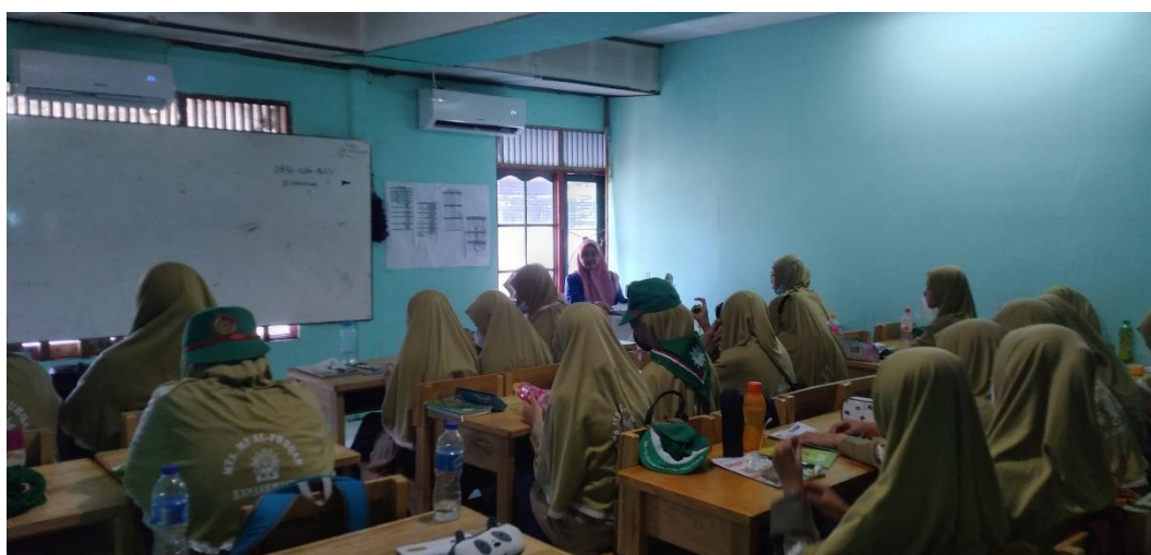
Gambar 4.7. Pelaksanaan Uji Instrumen Tes

Tes yang diberikan kepada siswa setelah semua materi telah dipelajari, tes berupa soal yang terdiri dari 4 soal berdasarkan indikator kemampuan penalaran matematika yang telah disebutkan pada bab II.