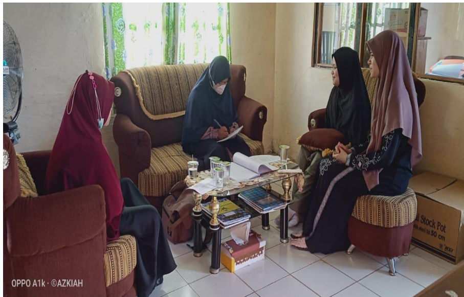
Wawancara dengan Wakil kepala asrama, pengawas dan santriwati asrama putri