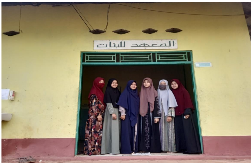
Bersama Wakil kepala asrama, pengawas dan santriwati asrama putri