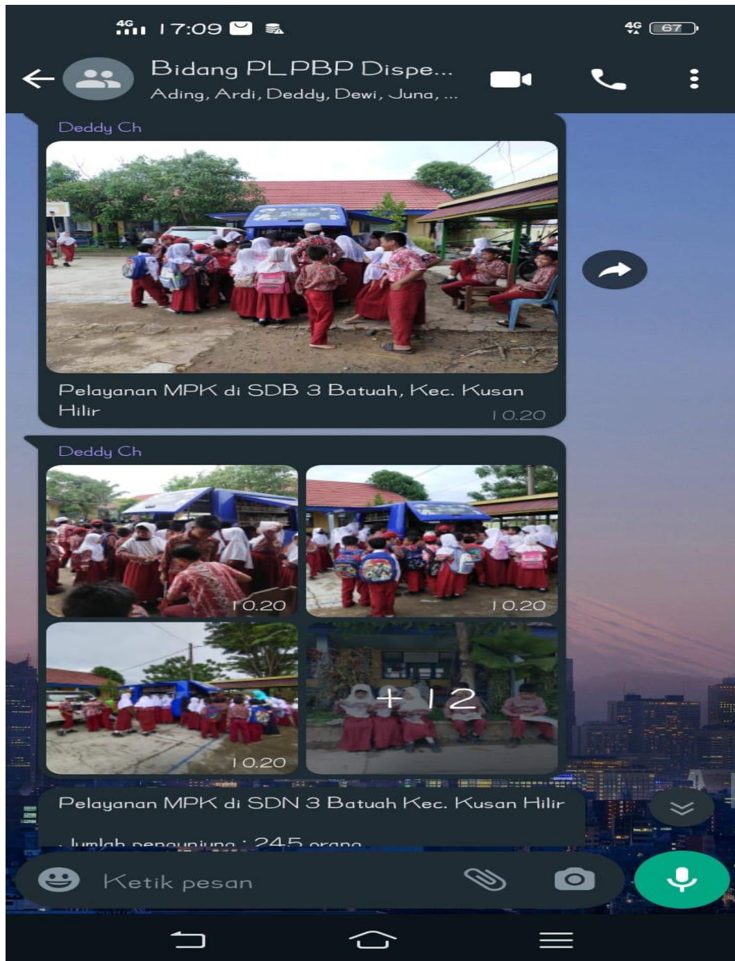
Gambar 12 laporan layanan perpustakaan keliling