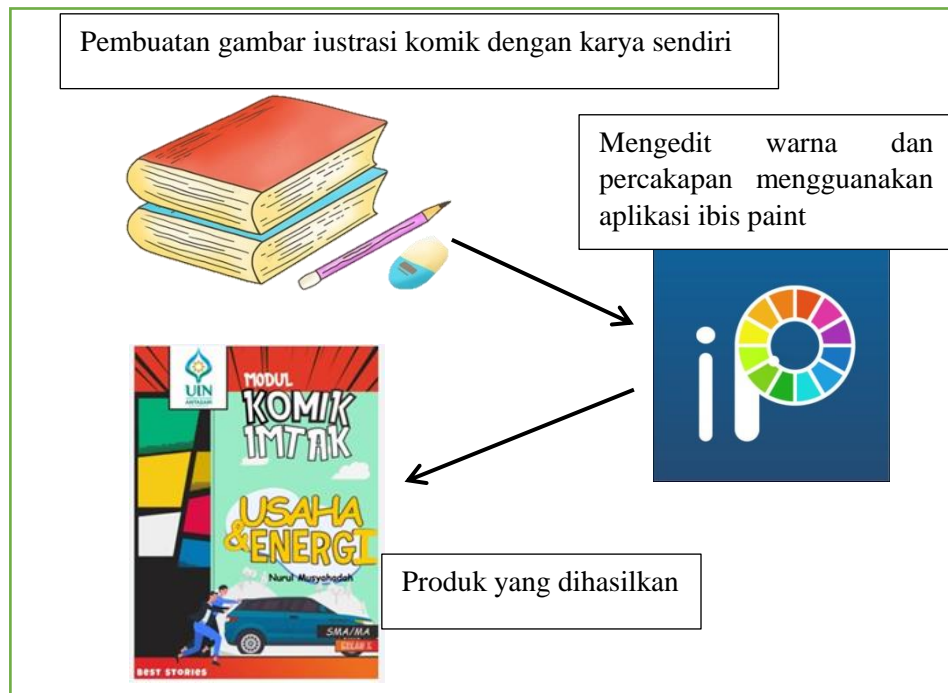
Gambar 3.2 Tahap Penyusunan Modul Komik Fisika

Rancangan awal produk modul meliputi tampilan, bahasa, ukuran dan materi yang disesuaikan dengan KD. Rancangan awal yang akan disusun akan menghasilkan draft Modul seperti pada gambar 3.2.