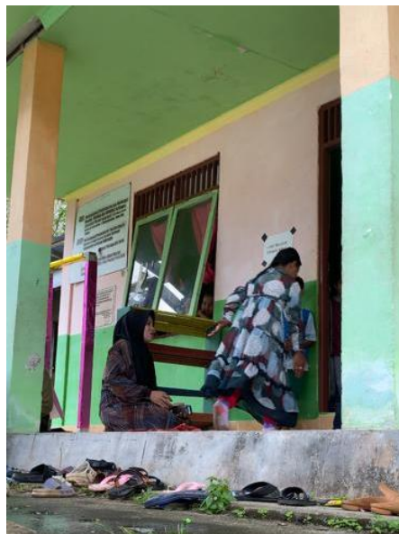
Gambar 1.5 Anak Ketika Melewati Guru

melewati guru yang entitasnya berada di dekat pintu, anak-anak otomatis bersikap mappatabe . (c1.03)