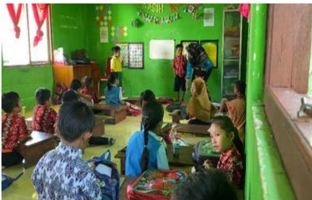
Gambar 1.4 Guru Mempraktikkan Sikap Mappatabe

Menariknya adalah sikap mappatabe yang diterapkan pada anak ketika di sekolah tidak masuk ke dalam rencana pembelajaran, namun sikap mappatabe tersebut dilakukan melalui pembiasaan disela-sela kegiatan belajar mengajar.