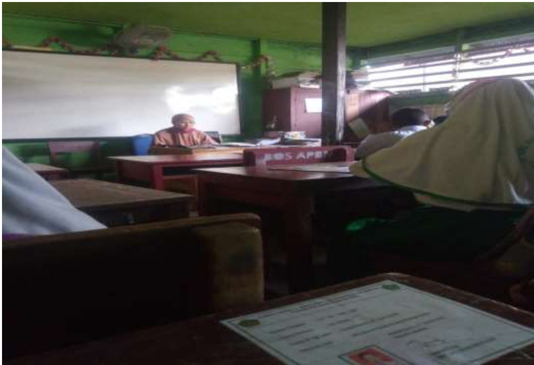
Photo Observasi Proses Pembelajaran Kelas III A