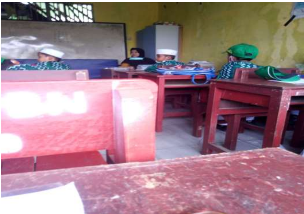
Photo Observasi Proses Pembelajaran Kelas I B