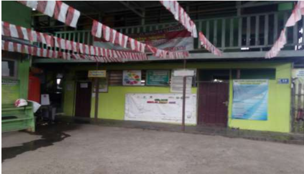
Halaman Depan Sekolah MI Nurul Huda Mantuil Banjarmasin