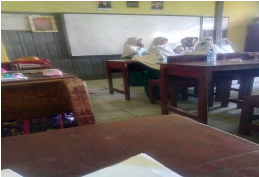
Photo Observasi Proses Pembelajaran Kelas I A