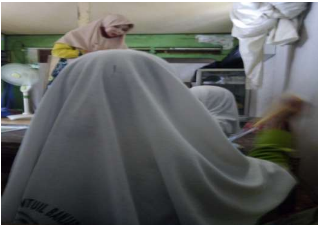
Photo Observasi Proses Pembelajaran Kelas II B