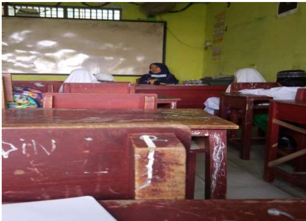
Photo Observasi Proses Pembelajaran Kelas III B