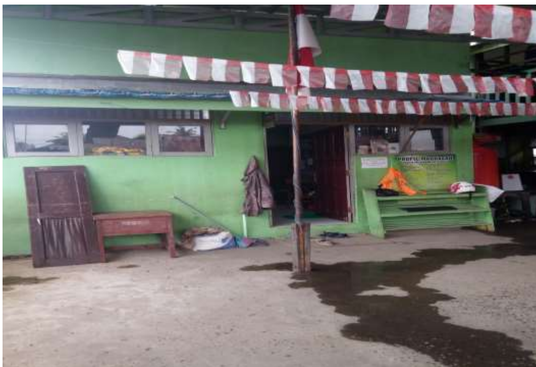
Halaman depan kator guru MI Nurul Huda Mantuil Banjarmasin