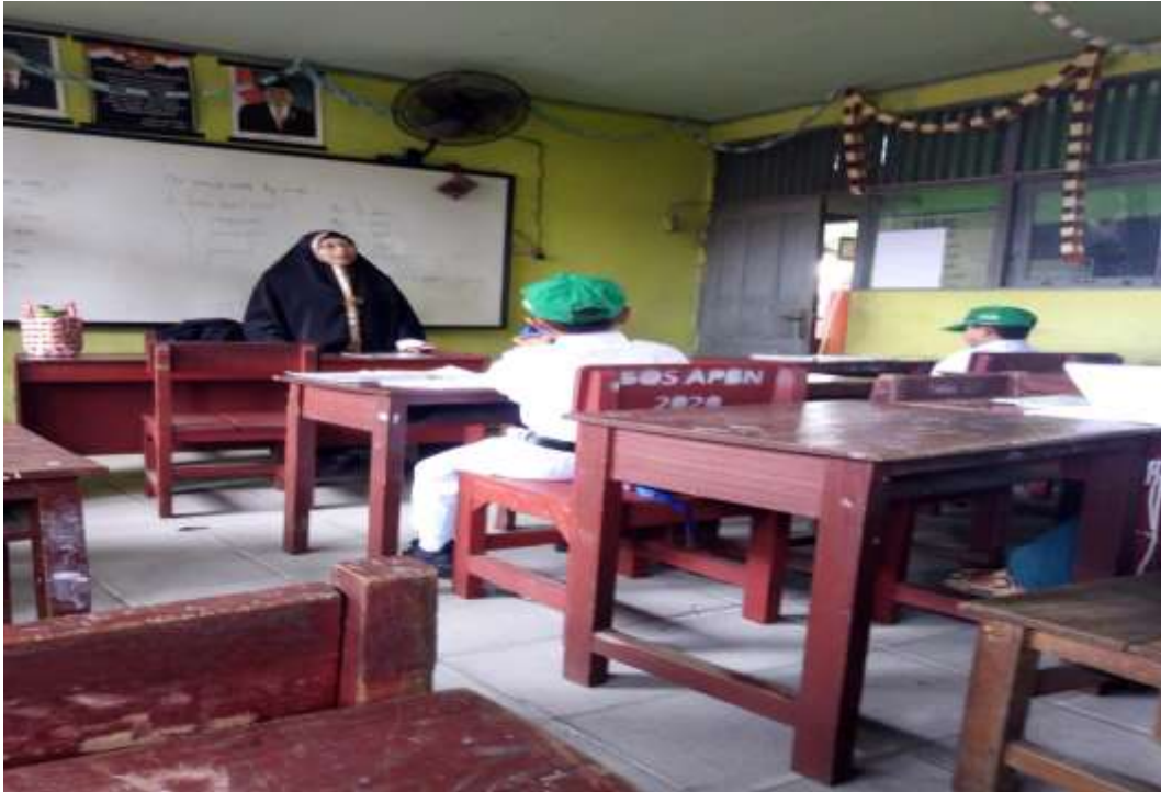
Photo Observasi Proses Pembelajaran Kelas II A