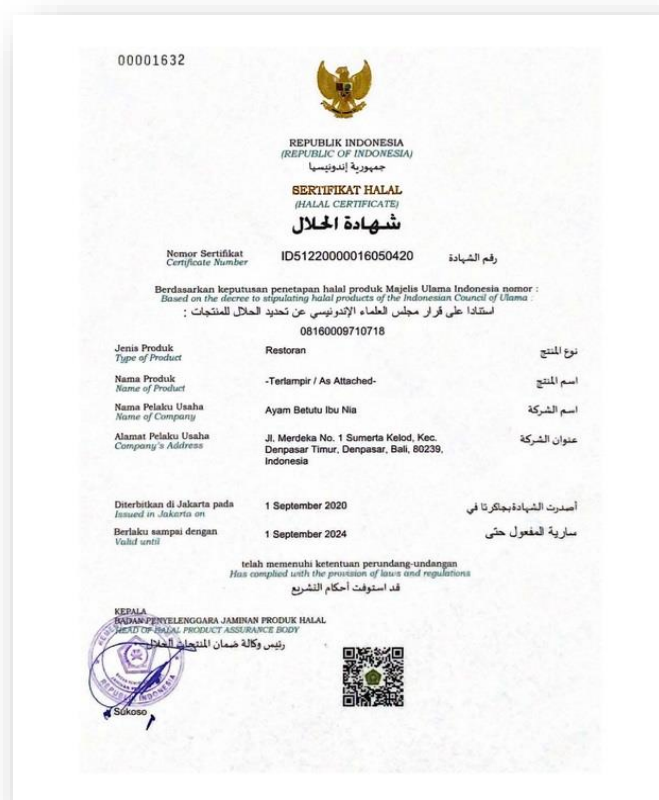
GAMBAR 4.2 SERTIFIKAT HALAL BPJPH