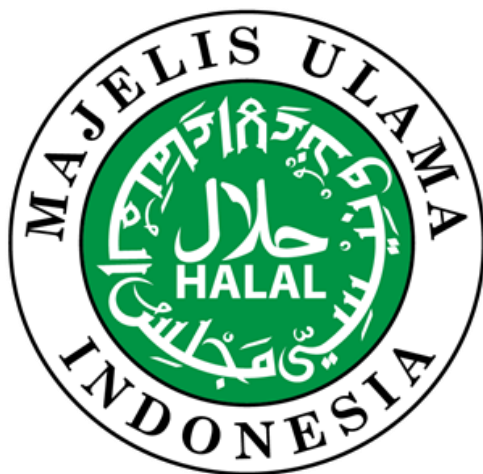
GAMBAR 4.3 LOGO HALAL LPPOM MUI