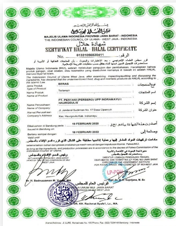
GAMBAR 4.4 SERTIFIKAT HALAL LPPOM MUI