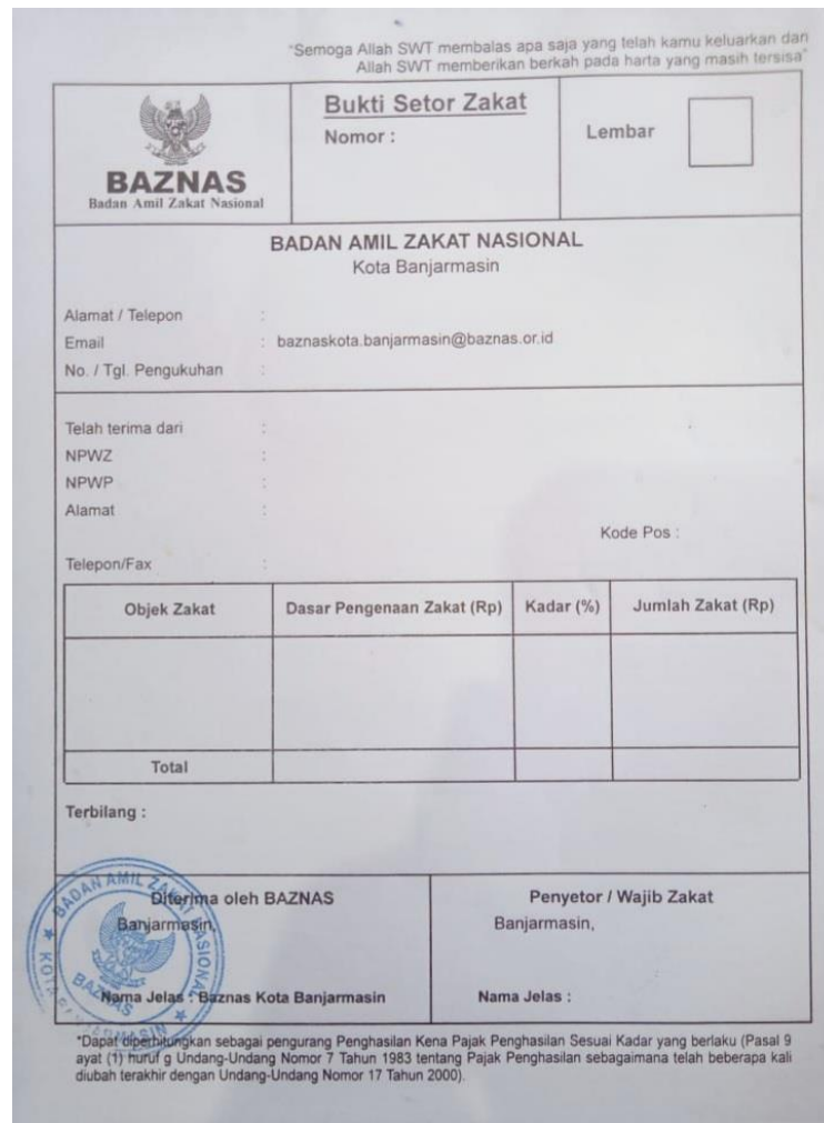
Gambar 1 : Bukti Setor Zakat BAZNAS Kota Banjarmasin

Adapun draft bukti setor zakat yang diberikan oleh BAZNAS Kota Banjarmasin adalah seperti berikut: