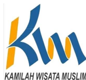
GAMBAR 4.1 Logo Travel PT. Kamilah Wisata Muslim