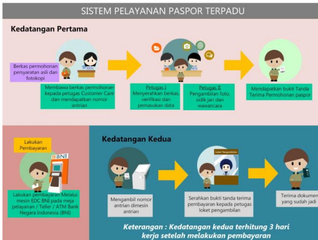
Gambar 6 : Sistem Pelayanan Paspor Terpadu