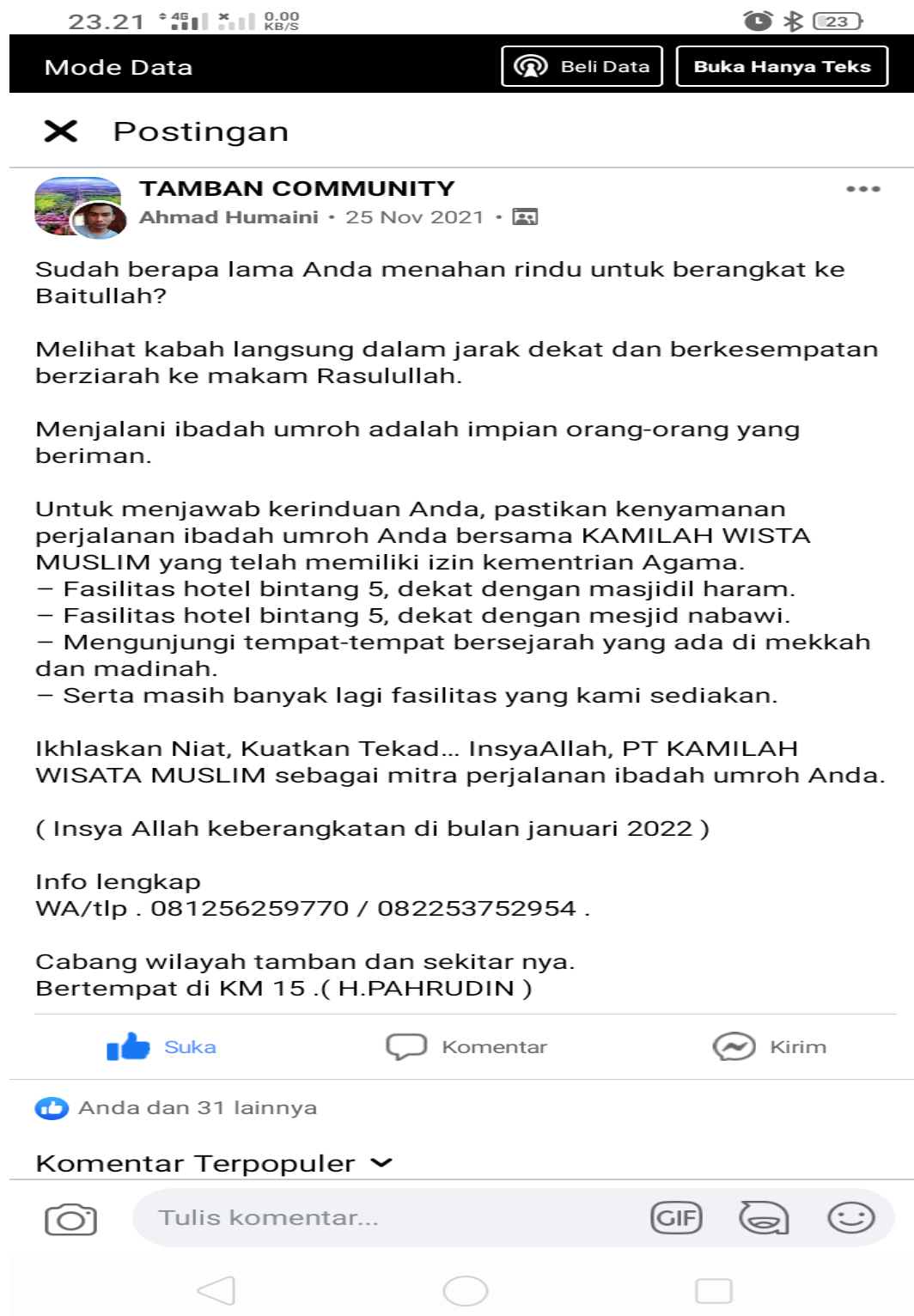
Gambar 14 : Promosi melalui media aplikasi facebook