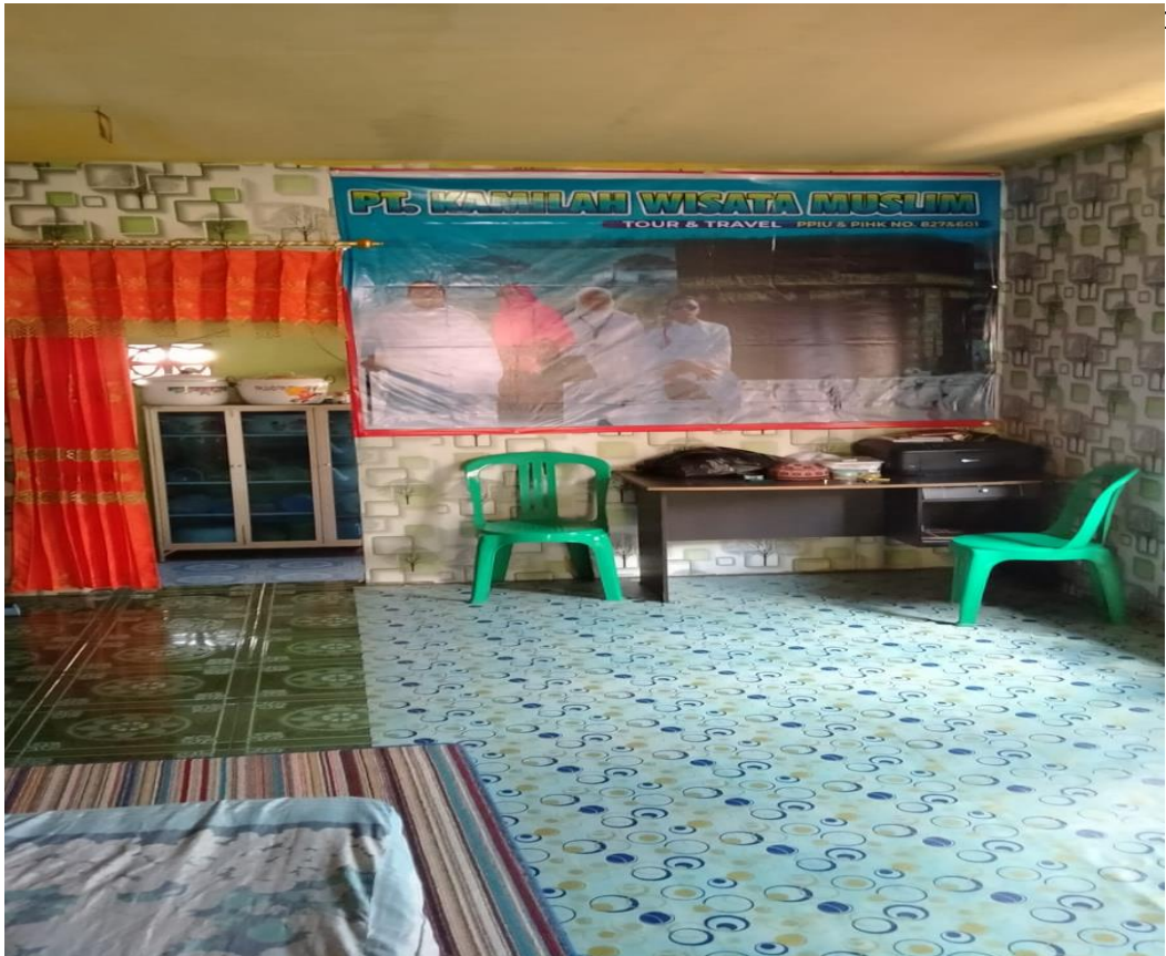
Gambar 5 : Bagian dalam kantor Travel PT. Kamilah Wisata Muslim Desa Tamban Mekarsari. Biasanya di tempat ini juga dilaksanakan kegiatan manasik.