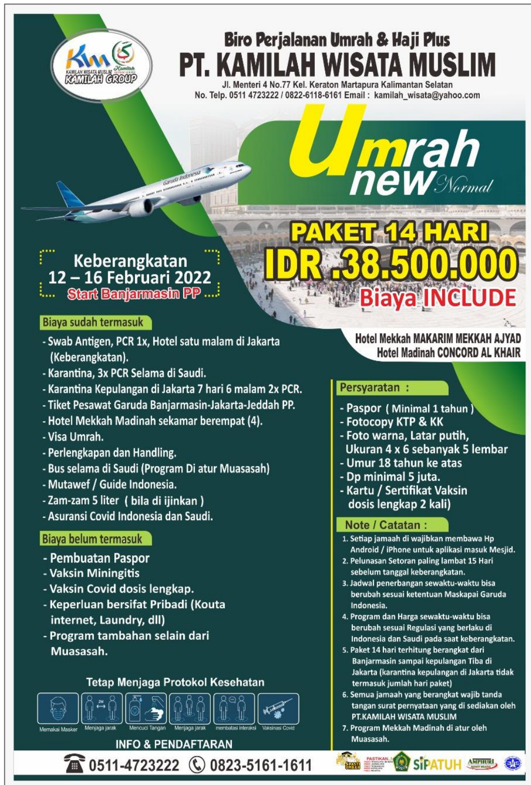
Gambar 11 : Brosur terbaru dengan harga terbaru di awal tahun 2022