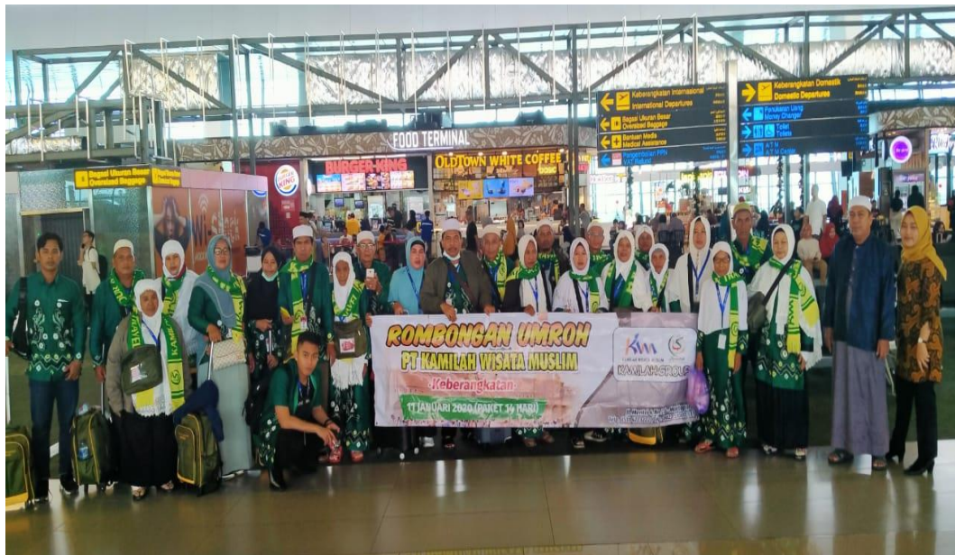
Gambar 3 : Keberangkatan jemaah umrah bulan Januari 2020