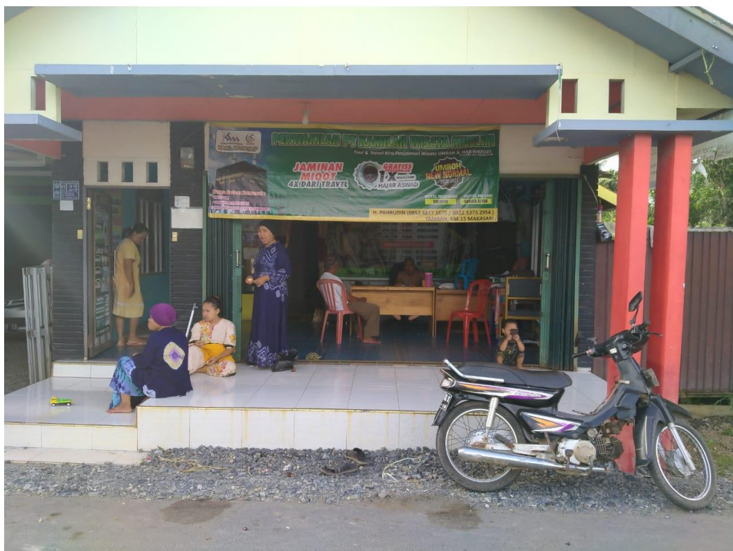
Gambar 4 : Kantor Travel PT. Kamilah Wisata Muslim Desa Tamban Mekarsari