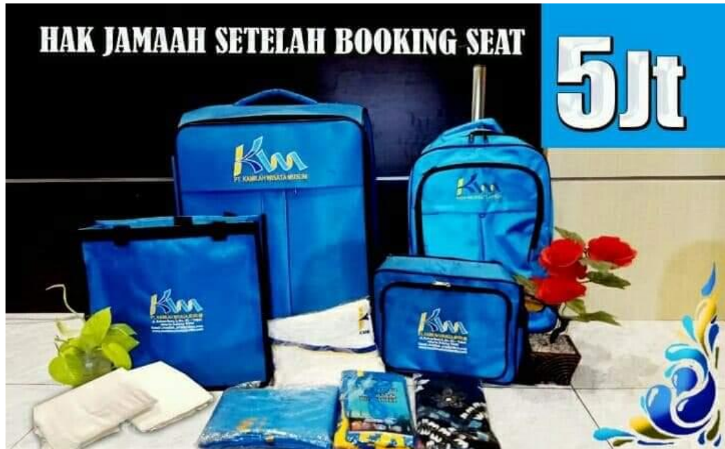
Gambar 1 : Perlengkapan umrah