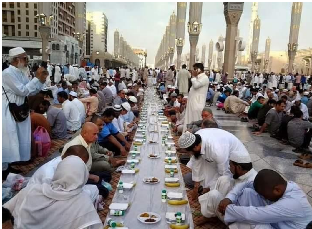
Gambar 8 : Suasana berbuka puasa saat umrah pada bulan Ramadhan tahun 2017