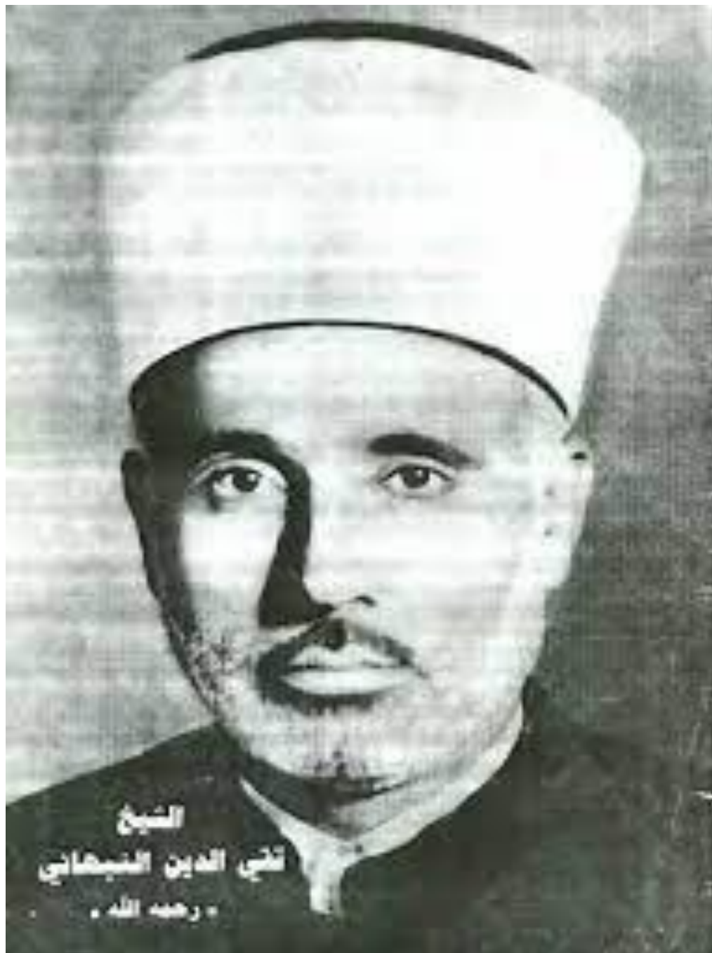
Gambar 2. Syaikh Taqiyuddin an Nabhani