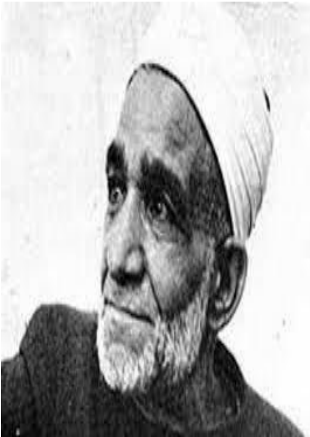
Gambar 1. Syaikh Mahmud Syaltut