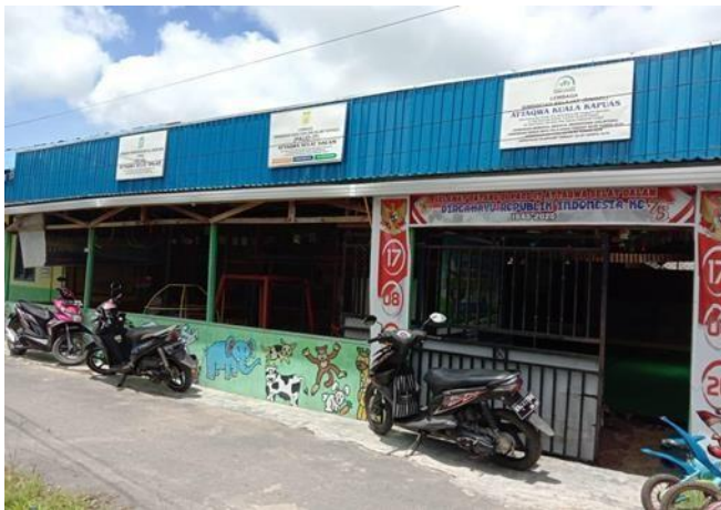
Gambar 4.1 Tk IT Attaqwa Selat Dalam Kab. Kapuas

Sebelum peneliti menyajikan data tentang Implementasi Lagu Dan 99 Gerakan Asma Ul-Husna Dalam Mengembangkan Kecerdasan Kinestetik Anak Kelompok B yang ada di TK IT Attaqwa Kab. Kapuas, peneliti akan menyajikan gambaran singkat mengenai lokasi penelitian.