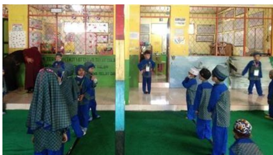
Gambar 4.4 beberapa anak maju ke depan sebagai instruktur senam

Dari observasi selama 3 hari dan wawancara 3 hari yang dilakukan peneliti maka pelaksanaan kegiatan gerak dan lagu khususnya lagu asma ul- husna ini dilakukan setiap pagi hari pukul 07.10-08.00 Wib. Dimana semua anak- anak yang sudah berada di sekolah sudah siap untuk baris di tempat kegiatan gerak dan lagu berlangsung, sekitar pukul 07.15 kegiatan gerak dan lagu untuk lagu asmaul husna ini dimulai, kegiatan tersebut berlangsung di luar ruangan di depan kelas kelompok B1 dan B2 (clp1.1).