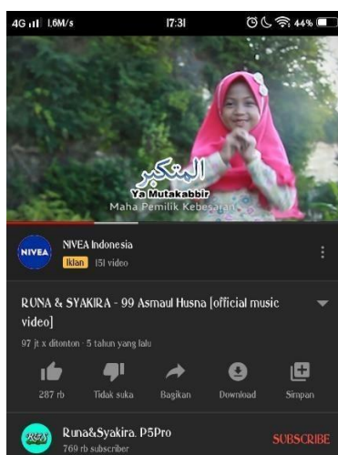
Gambar 4.3 channel youtube gerak dan lagu asma ul-husna

untuk mengembangkan kecerdasan kinestetik adalah dengan mengadakan senam dengan berbagai macam gerakan dan lagu setiap pagi hari dari senin s.d. sabtu. (cwgk1). Adapun contoh kegiatan untuk mengembangkan aspek lainnya yaitu dengan melakukan kegiatan klasikal dari jam 07.30 – 08.00 WIB yang mana materi dan kegiatannya berbeda beda, contoh materinya seperti doa sehari hari atau materi tentang hadis hadis. (cwgk1).