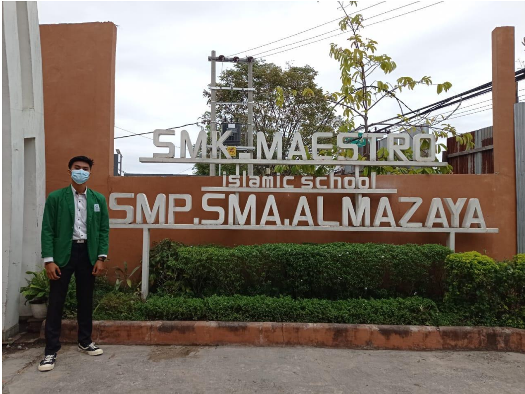
Proses penjajakan pertama