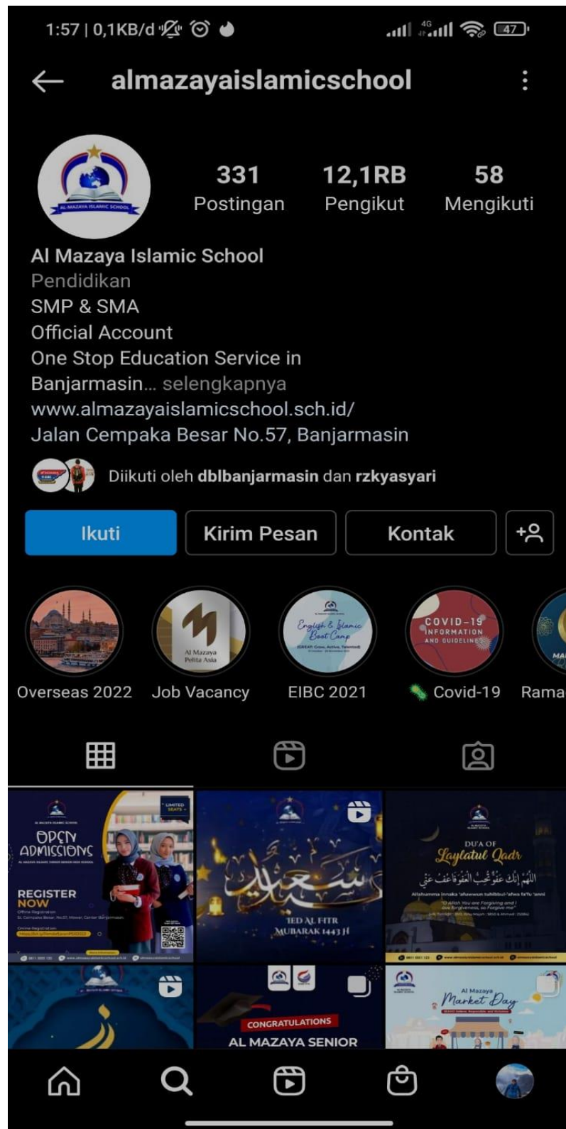
Laman Instagram SMP Al Mazaya Banjarmasin