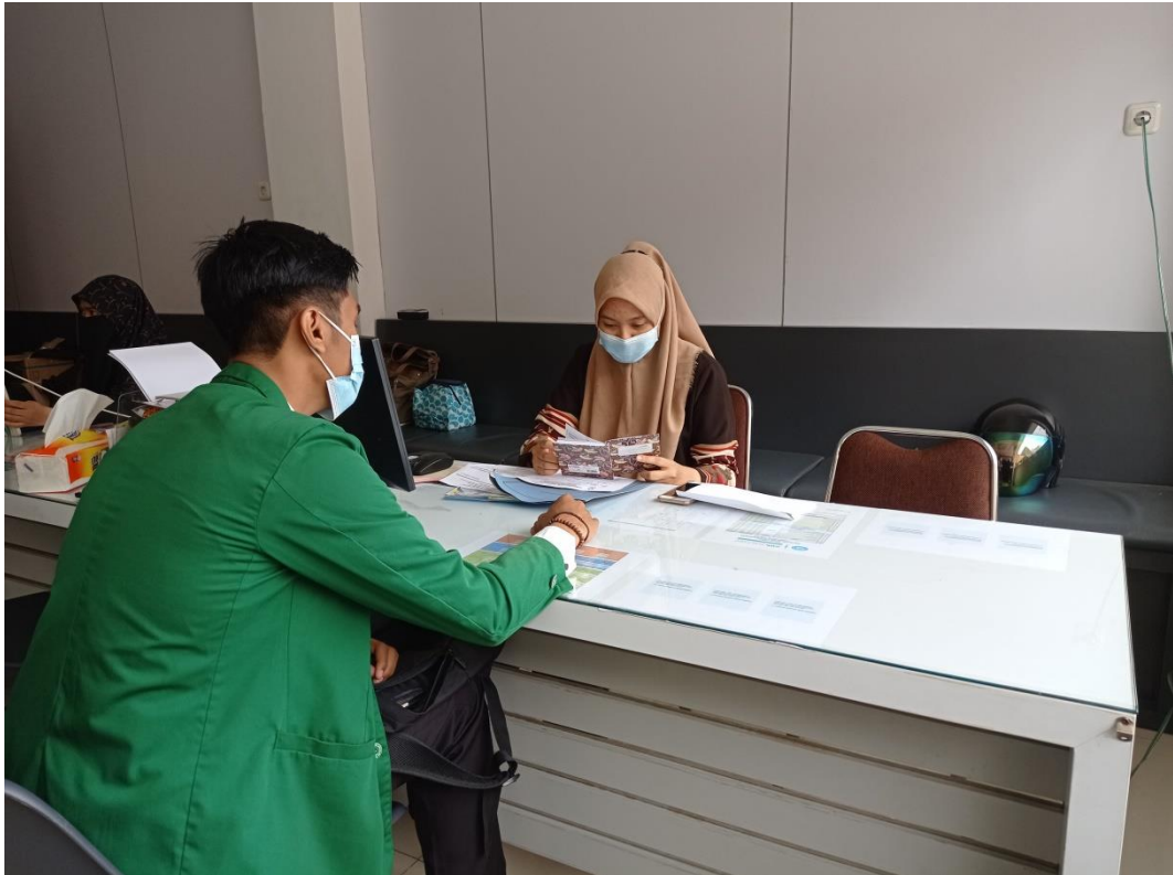
Proses perizinan penelitian