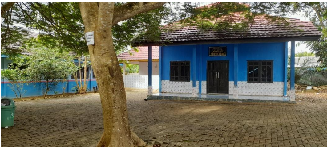
Gambar. Mushola SMP Negeri 6 Pelaihari