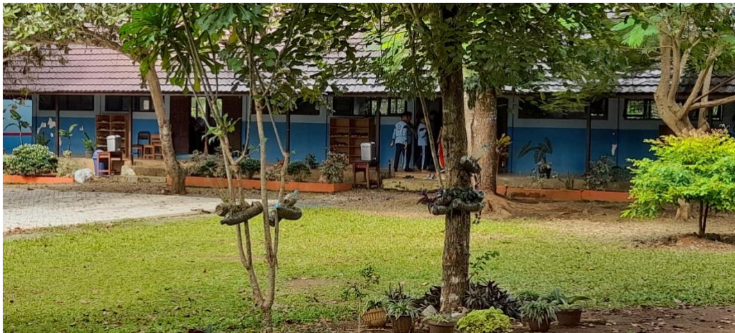
Gambar. Ruang Kelas siswa SMP Negeri 6 Pelaihari