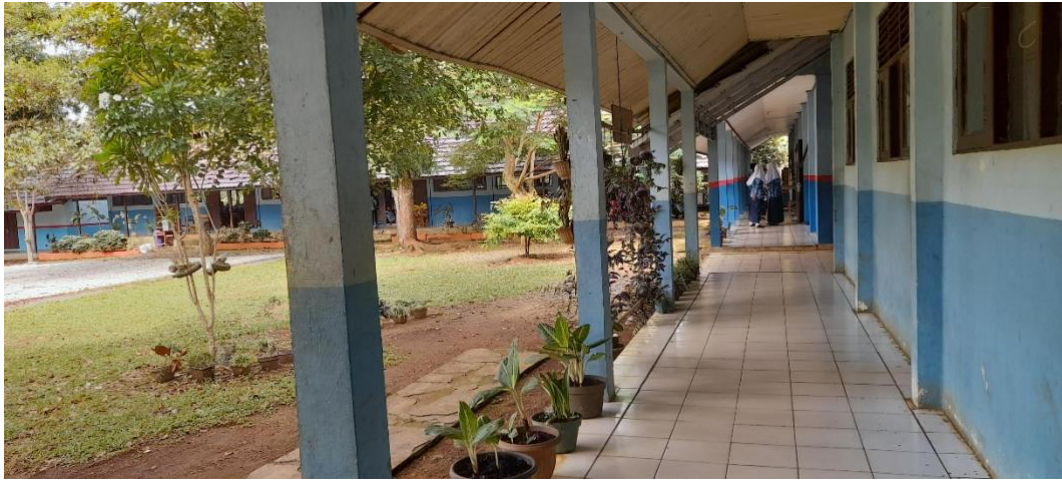
Gambar. Ruang Kelas siswa SMP Negeri 6 Pelaihari