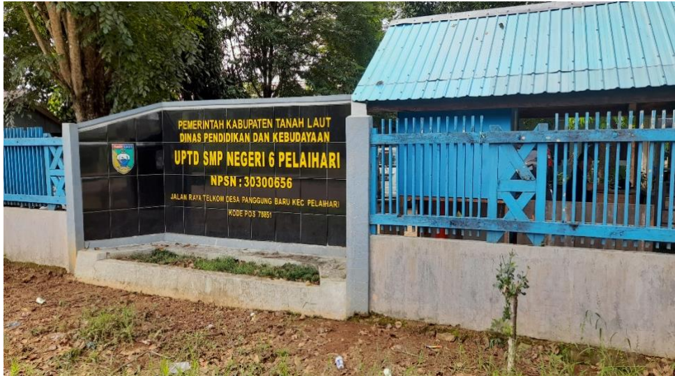
Gambar. UPTD SMP Negeri 6 Pelaihari