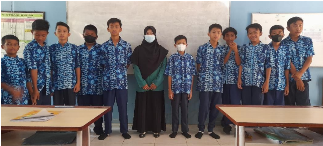
Gambar. Siswa kelas VII A SMP Negeri 6 Pelaihari