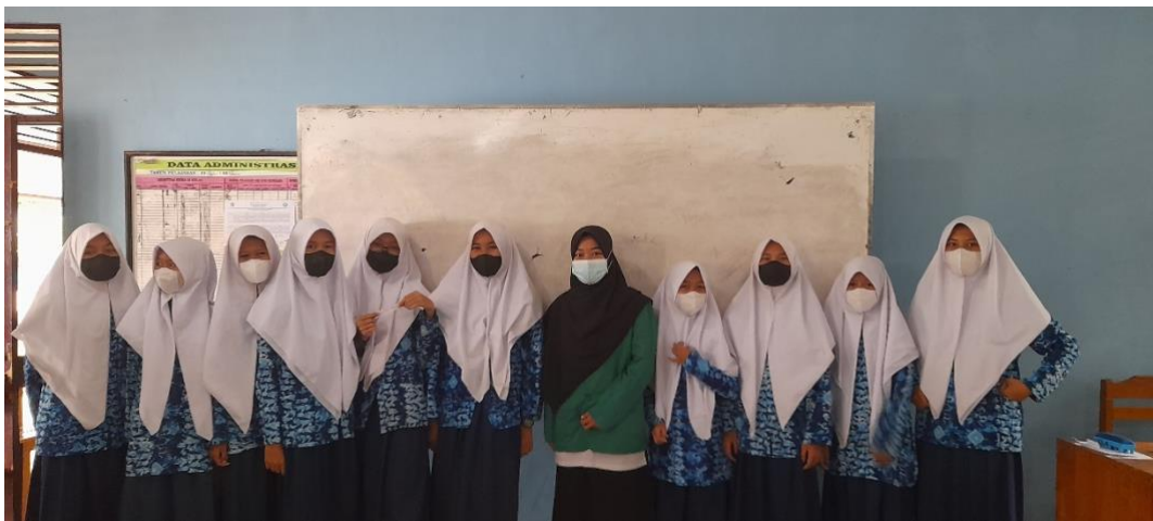
Gambar. Siswi kelas VII A SMP Negeri 6 Pelaihari