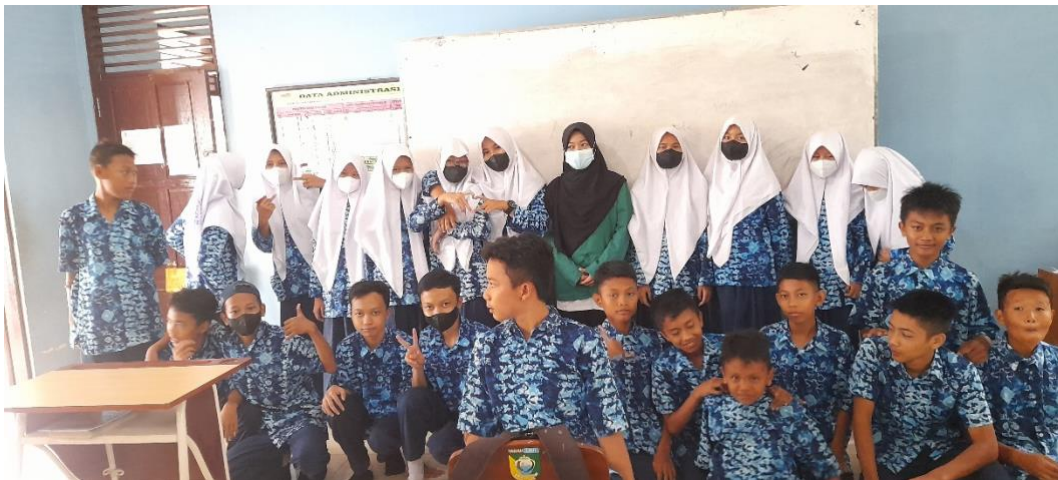
Gambar. Siswa/i kelas VII B SMP Negeri 6 Pelaihari