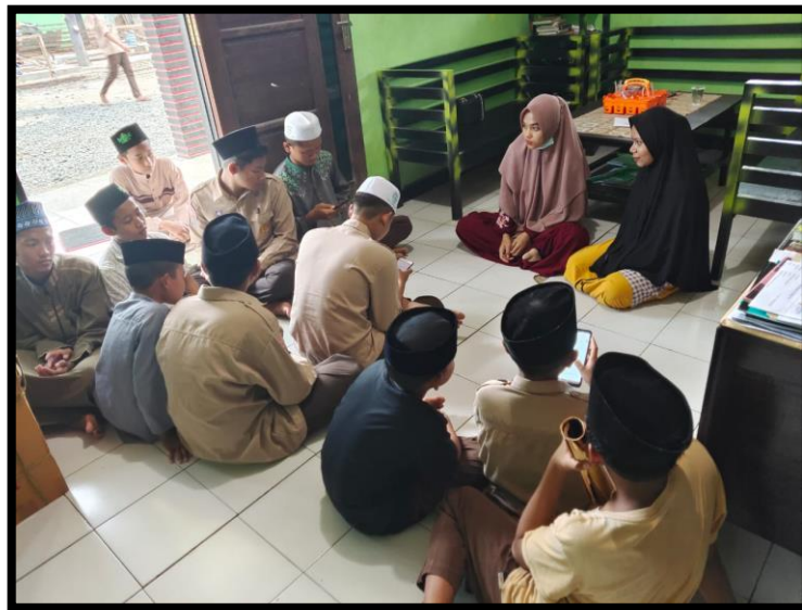
Gambar 5. 3 Proses pengisian kuesioner