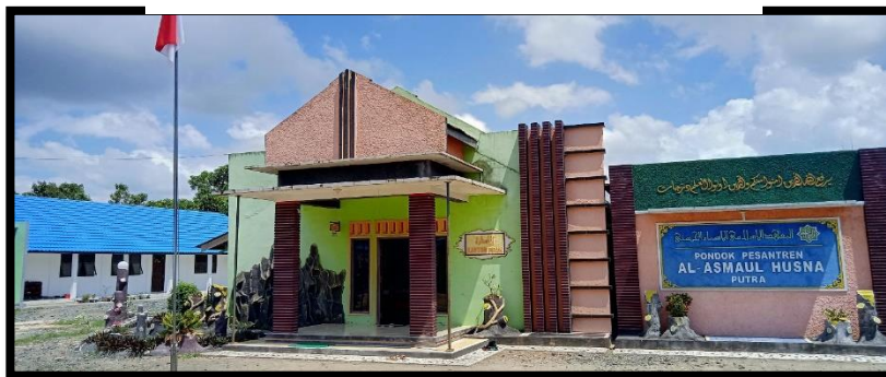
Gambar 5. 2 Kantor