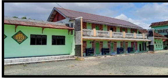
Gambar 5. 1 Asrama Putra