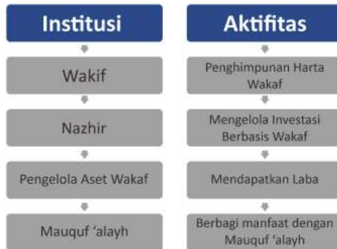
Gambar. 4.6 Alur Institusi dan Aktifitas Wakaf