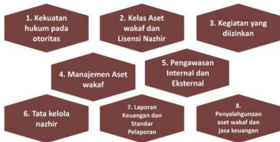
Gambar 4.5 : Delapan prinsip utama peraturan wakaf