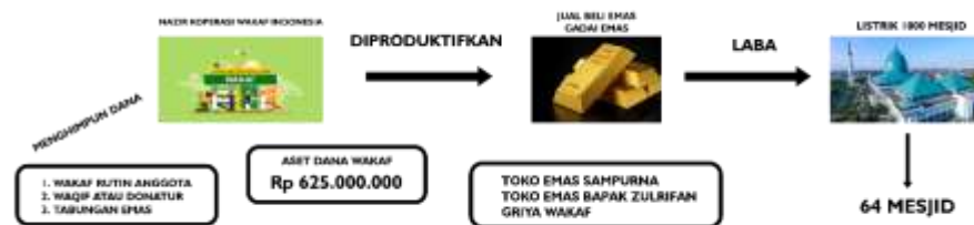
Gambar 4.4: Alur Wakaf Produktif koperasi wakaf Indonesia