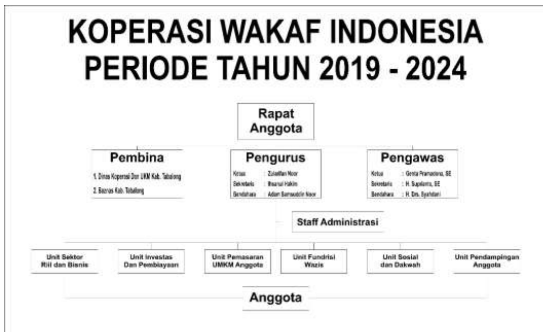
Gambar. 4.1 :Struktur organisasi koperasi wakaf Indonesia