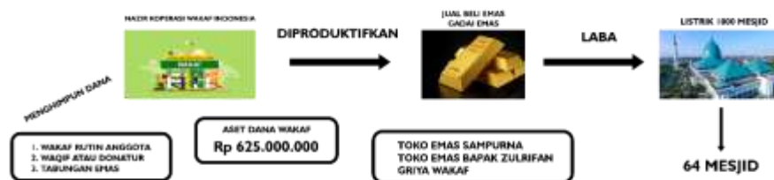
Gambar 4.8: Alur Wakaf Produktif koperasi wakaf Indonesia