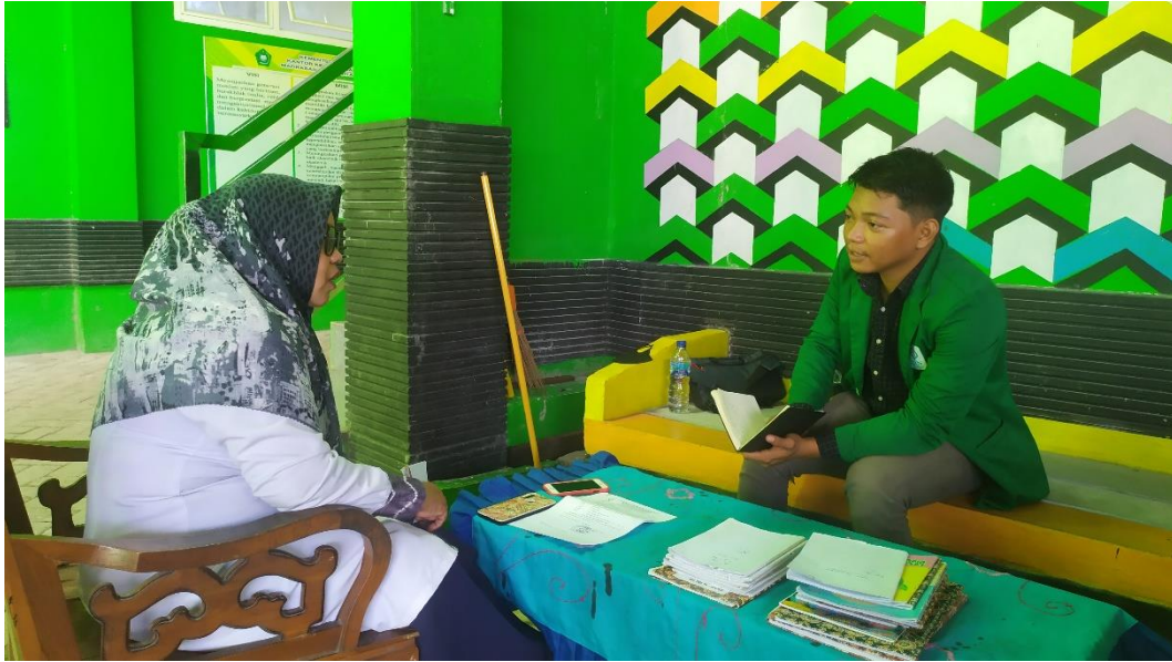
Lampiran VI: Gambar Wawancara Guru Akidah Akhlak