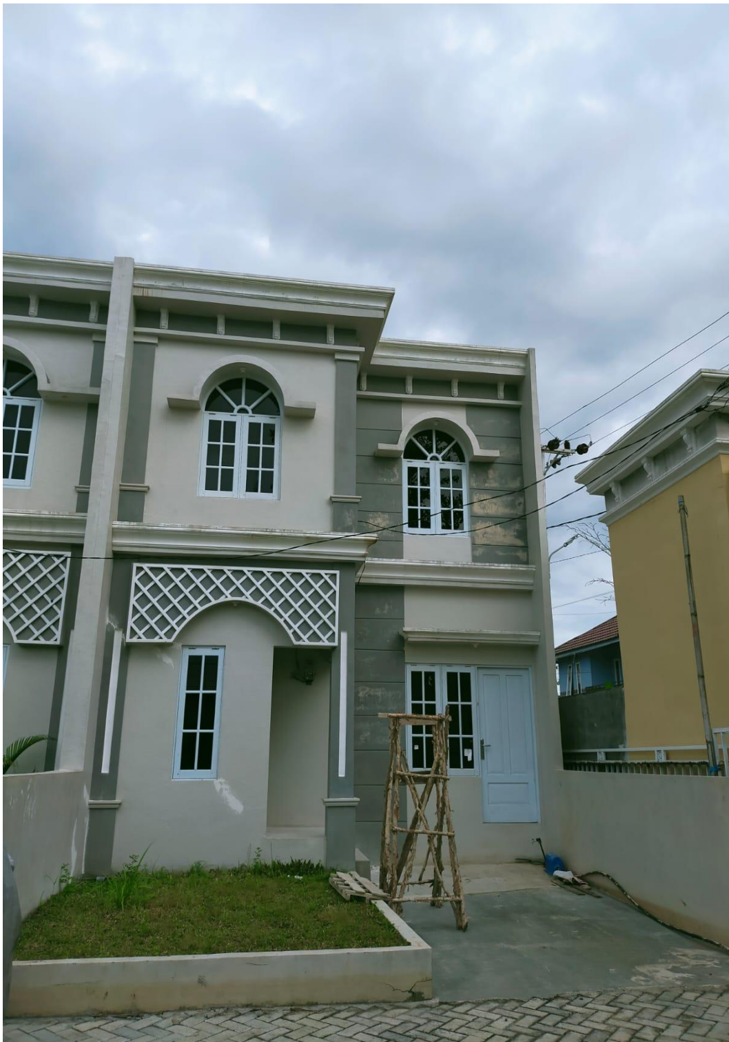
Rumah type 60