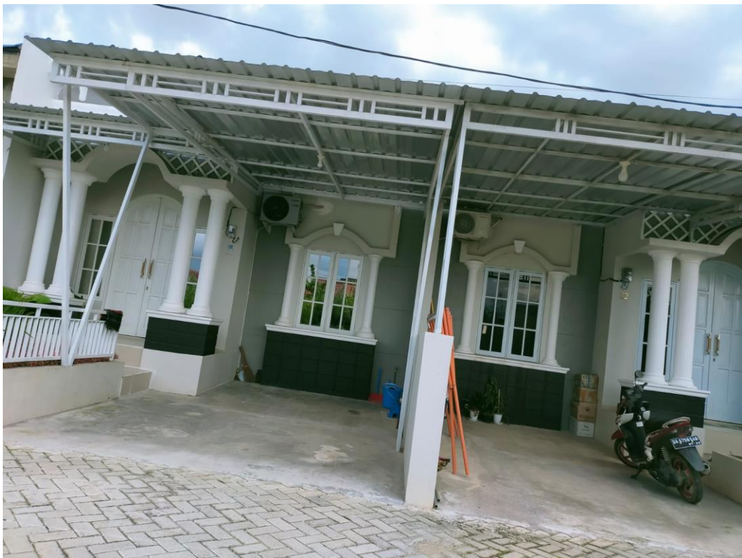
Rumah type 36