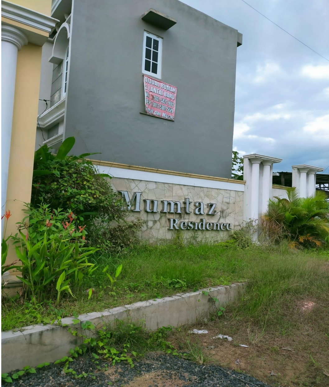
Gerbang Al-Mumtaz Residence