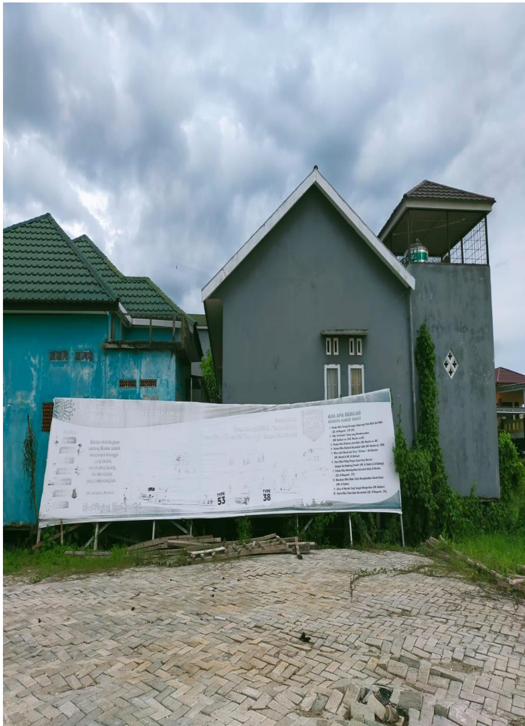
Spanduk AI Mumtaz Residence