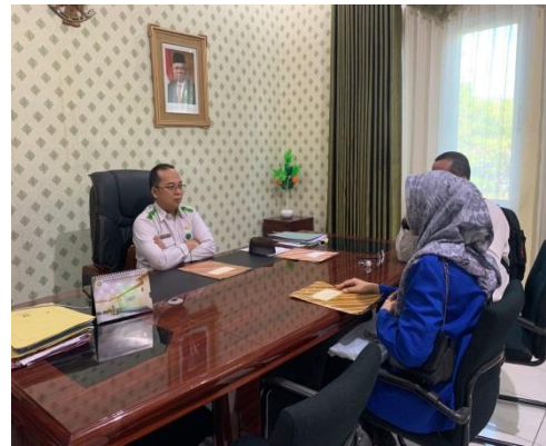
Agama Kabupaten Tapin