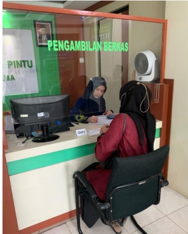
Pengambilan surat persetujuan riset