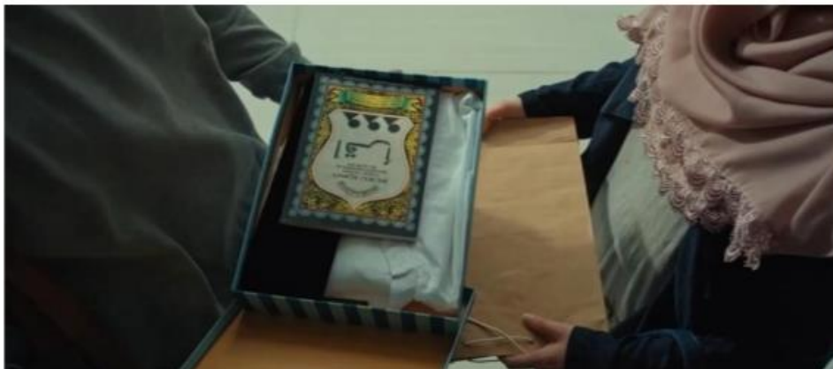
Gambar 1.1 Tentang simbolisasi awal belajar al-Qur'an, sumber utama ajaran agama Islam