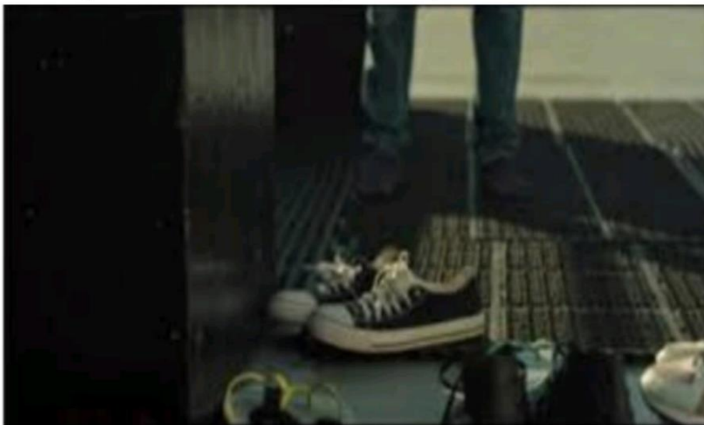
Gambar 1.2 Tentang melepas alas kaki saat dimesjid, mesjid tempat suci