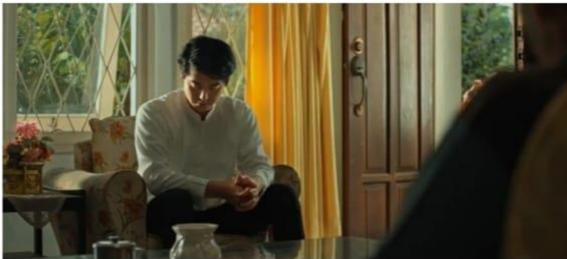
Gambar 1.5 Agama tidak dicerminkan dari berpakaian