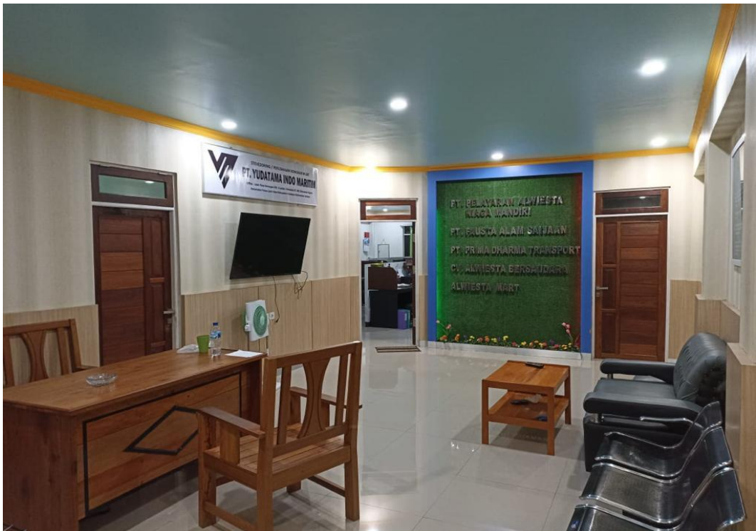
Gambar 6: Ruangan tunggu PT. Pelayaran Alwiesta Niaga Mandiri