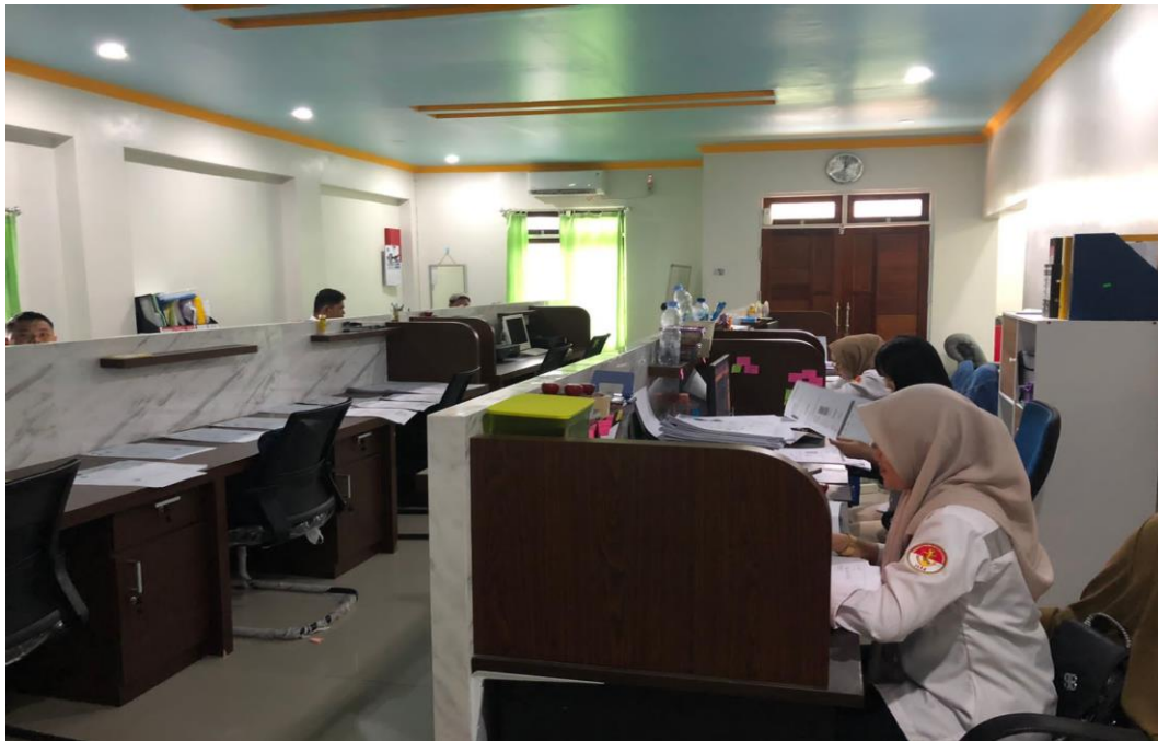
Gambar 4 : Kegiatan bekerja karyawan PT. Pelayaran Alwiesta Niaga Mandiri