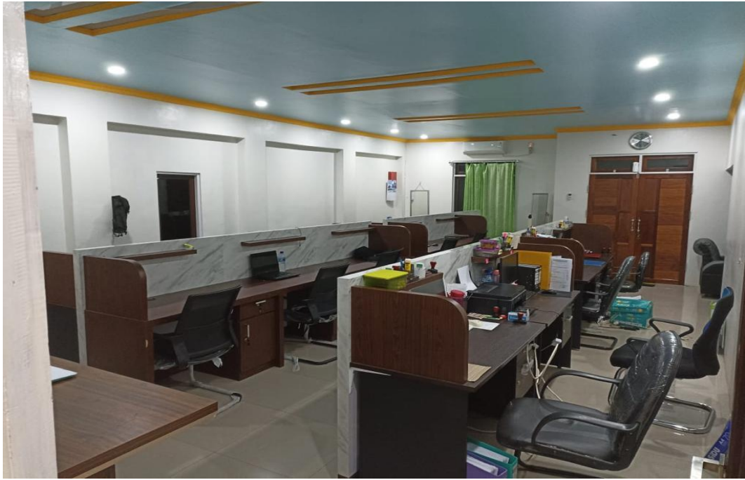
Gambar 5: Ruangan kerja PT. Pelayaran Alwiesta Niaga Mandiri