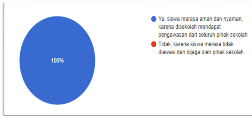
Gambar Lingkaran 4.4 Siswa yang Merasa Aman dan Nyaman Saat Berada Disekolah.

Diagram lingkaran di atas menunjukkan siswa yang merasa aman dan nyaman di SDN Pengambangan 6. Sebanyak 100% siswa mengaku sangat merasa nyaman karena lingkungan yang merasa aman dan nyaman karena mendapat pengawasan dari seluruh pihak sekolah.