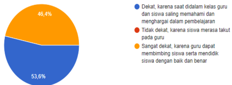
Gambar Lingkaran 4.2 Kedekatan siswa dengan guru:

Diagram lingkaran diatas menggambarkan 46,4% guru sangat dekat dengan siswa karena guru dapat membimbing siswa serta mendidik siswa dengan baik dan benar, kemudian 53,6% guru dan siswa dekat karena saat didalam kelas guru dan siswa saling memahami dan menghargai dalam pembelajaran. Dari persentase ini guru dan siswa mampu bekerja sama didalam sekolah sangat baik bahkan tidak ada yang tidak dekat dengan guru. Siswa disini mampu berkomunikasi dengan sangat baik.