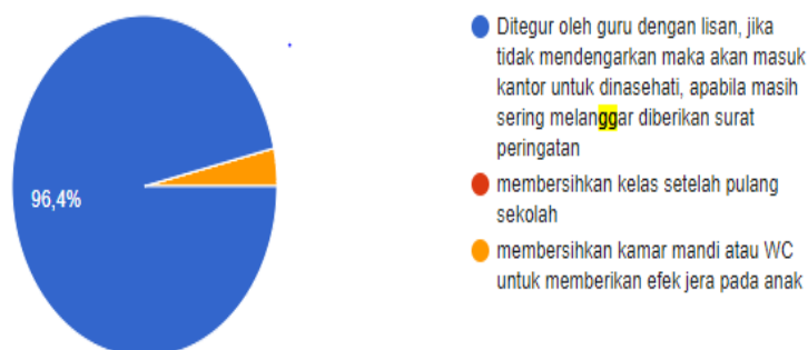
Gambar Lingkaran 4.3 Hukuman yang Diberikan Saat Melanggar Tata Tertib

Dari hasil diagram lingkaran diatas didapatkan hasil yaitu 96,4% siswa saat melakukan kesalahan hanya ditegur dulu oleh guru dengan lisan, jika tidak mendengarkan maka akan masuk kantor untuk dinasehati, apabila masih sering melanggar diberikan surat