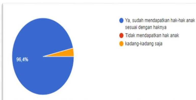
Gambar Lingkaran 4.5 Siswa yang Mendapatkan Hak-Haknya

Diagram lingkaran di atas menunjukkan siswa yang mendapatkan hak-hak anak di SDN Pengambangan 6. Sebanyak 96,4% siswa mengaku sudah mendapatkan hak-hak anak sesuai dengan haknya. Sebanyak 6% siswa mengaku kadang- kadang saja. peneliti dapat mengambil kesimpulan bahwa mayoritas hak-hak siswa sudah dapat terpenuhi dengan baik.