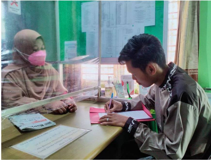
Dokumentasi 1: wawancara bersama Kepala Bidang Pendistribusian