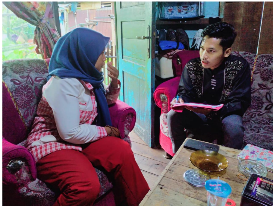
Dokumentasi 2: wawancara bersama mustahik penerima program ZCD