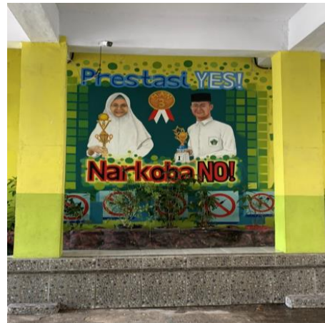
Kalimat Motivasi Untuk Pelajar