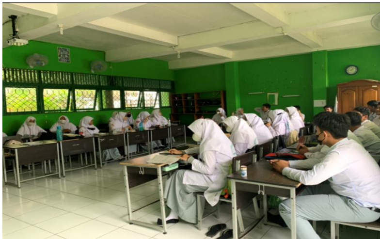
Pembelajaran di Kelas Setelah Pemberian Layanan