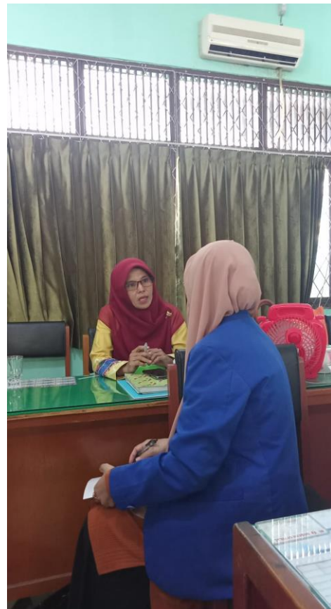
Wawancara Guru Mata Pelajaran