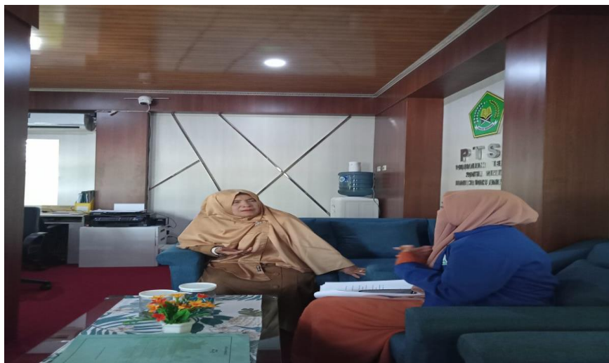
Wawancara Kepala Sekolah