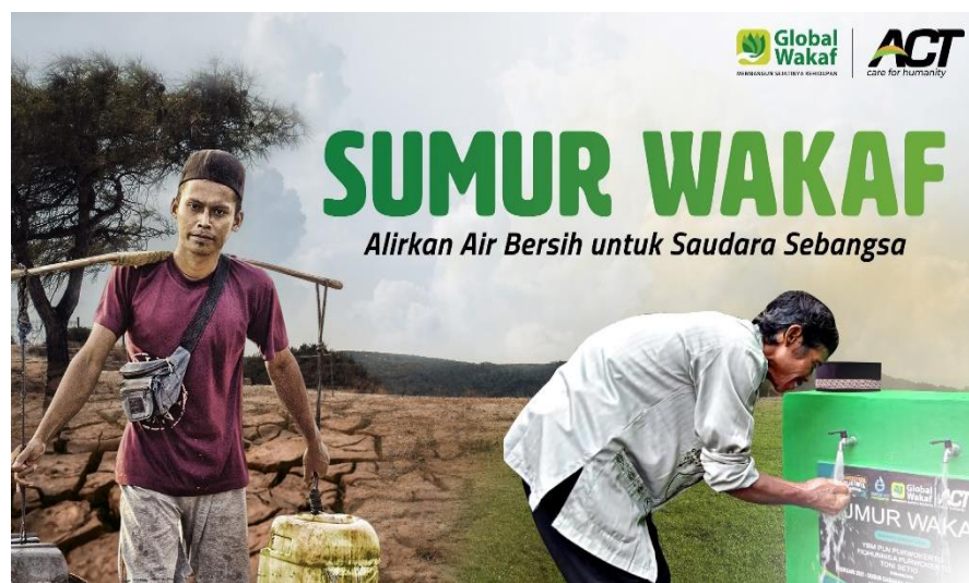
Gambar 4. 6 Program SW (Sumur Wakaf)

menopang kehidupan saudara sebangsa yang sangat kesulitan dalam mendapatkan akses air bersih. Adapun jenis-jenis SW (Sumur Wakaf) sumur wakaf keluarga, sumur wakaf komunal dan sumber wakaf produktif.