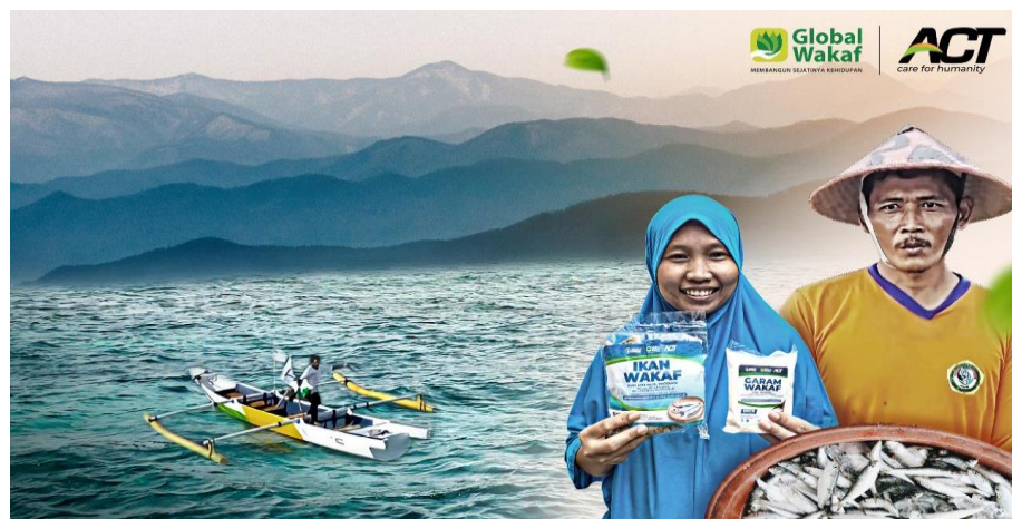
Gambar 4. 5 Program WPLP (Wakaf Pangan Laut Produktif)

WPLP (Wakaf Pangan Laut Produktif) adalah sebuah program pusat pengelolaan hasil tangkapan dan budidaya ikan, untuk meningkatkan nilai produksi dan pemasaran, sehingga terwujudnya kesejahteraan bagi nelayan dan kedaulatan pangan laut Indonesia adapun bentuk programnya, yaitu pangan lumbung pangan laut wakaf, keramba jarring apung, dan paket pangan laut untuk keluarga prasejahtera.