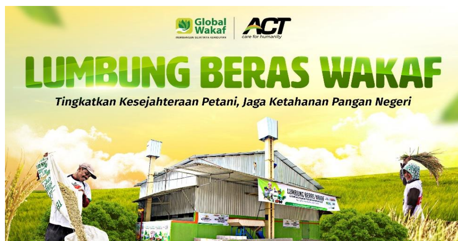
Gambar 4. 4 Program LBW (Lumbung Beras Wakaf)

LBW (Lumbung Beras Wakaf) adalah sebuah program yang pengelolaan dan pengolahan gabah hasil panen para petani. Beras dari lumbung ini kemudian didistribusikan kepada saudara sebangsa yang membutuhkan, melalui program-program kemanusiaan pada ACT. Program LBW hadir sebagai ikhtiar untuk meningkatkan kesejahteraan petani dan memenuhi kebutuhan pangan masyarakat, hingga ketahanan pangan dapat terus terjaga.