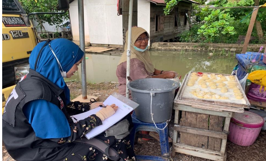
Gambar 4. 8 kegiatan Assessment kepada para penerima manfaat yang dilakukan oleh pendamping program WMUM

Dalam proses pengorganisasian, setelah terjalankannya pra imlementasi nantinya diharapkan untuk mampu bekerja sama dengan yang lainnya dengan cara menyamakan tujuan yang ingin dicapai. Melihat dari segi proses pengorganisasian dari Aksi Cepat Tanggap dalam program Wakaf Modal Usaha Mikro peneliti menilai bahwa proses pengorganisasiannya telah menerapkan proses pengorganisasian sesuai dengan teori George R.Terry sebagai berikut, yaitu: