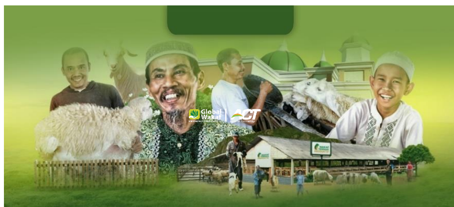
Gambar 4. 3 Program WTP (Wakaf Ternak Produktif)

WTP (Wakaf Ternak Produktif) sebuah program yang merupakan pendampingan dan pelatihan beternak secara berkelanjutan, yang sudah ada dalam pelaksanaannya berkolaborasi. Dengan pesantren-pesantren yang ada di Indonesia. Tujuan dalam program WTP adalah menjadikan pesantren sebagai entitas mandiri secara ekonomi, memberikan sebuah keterampilan ternak kepada para santri dan masyarakat, memenuhi kebutuhan pangan (protein) bagi lingkungan pesantren, menjadikan pesantren sebagai pusat pengembangan ternak nasional dan membuka peluang kerja dan mensejahterakan masyarakat.