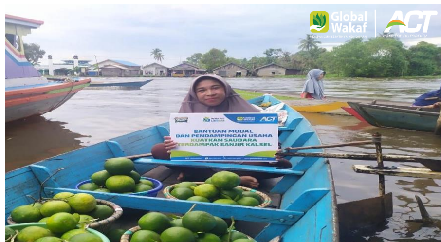
Gambar 4. 1 Program WMUM (Wakaf Modal Usaha Mikro)

WMUM hadir sebagai solusi atas problem kemiskinan umat khususnya untuk para pelaku UMKM (Usaha Mikro Kecil Menengah) yang mengalami kesulitan dalam mendapatkan permodalan usaha, dengan dengan kondisi ketidakmampuan dalam mengakses informasi terkait permodalan, sering dianggap belum bankable sehingga belum mampu mendapatkan fasilitas pembiayaan dari lembaga lain kecuali dari rentenir.