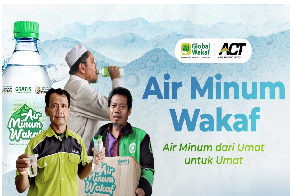
Gambar 4. 2 Program AMW (Air Minum Wakaf)

AMW (Air Minum Wakaf) sebuah program yang dikenal sebagai bantuan penyaluran air minum gratis yang di hadirkan langsung sebagai solusi atas kesehatan umat atas komersialisasi sumber daya air. AWM terus berikhtiar menghadirkan air minum gratis berkualitas sebagai penghilang dahaga umat. Sasaran dari pendistribusian ANW (Air Minum Wakaf) ini adalah masjid, mushola, pesantren dan madrasah, keluarga prasejahtera. 7