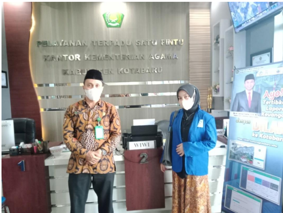
Foto bersama di PTSP kantor Kementerian Agama Kotabaru