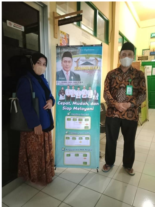
Pelaunching aplikasi SI MANDALIKA