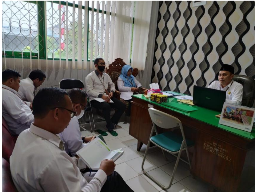
Diskusi bagian Subbag TU