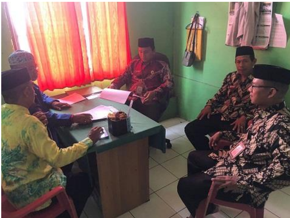
Kegiatan supervise pegawai Kementerian Agama kepada KUA Pulau Sembilan