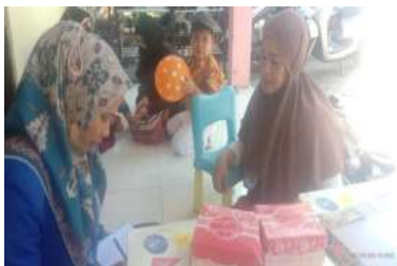
Gambar 4.11 wawancara dengan orang tua anak.

Evaluasi program parenting TK Tunas Harapan juga melihat pada perubahan perkembangan pengasuhan yang dilakukan oleh orang tua. Melalui wawancara dengan orang tua diperoleh data bahwa beberapa orang tua menerapkan program parenting , sebagai juga ada orang tua belum mampu dengan konsisten dalam menerapkan program parenting .