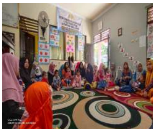
Gambar 4.1 Kegiatan Parents Gathering