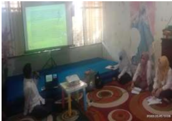
Gambar 4.7 Penyampaian materi oleh kepala sekolah

Setelah moderator mempersilahkan kepala sekolah untuk menyampaikan materi sesuai dengan tema pada hari itu. Pukul 09.30 presentasi pun dimulai oleh bapa Dadi. Pada awal pembukaan materi bapa Dadi membuka dulu acara dengan mengucapkan salam kepada semua yang telah berhadir pada acara tersebut. Setelah itu bapa Dadi menampilkan materi di LCD dengan tema “Mendidik Anak Di Era Digital”, pada materi ini disampaikan bahwa tugas orang tua itu mempersiapkan anak menghadapi zamannya. Sebagai orang tua, apakah sudah mempersiapkan anak untuk menghadapi era digital saat ini? Dan era kedepannya?. Setelah itu lanjut materi selanjutnya dijelaskan dulu apa era digital, hal-hal yang perlu orang tua diperhatikan orang tua, membimbing keseharian generasi digital dan penggunaan media digital sesuai dengan usi anak dan tahap perkembangan anak. Selanjutnya penyampaian materi tentang 32 perilaku orang tua yang membuat anak bisa melawan seperti berikut: