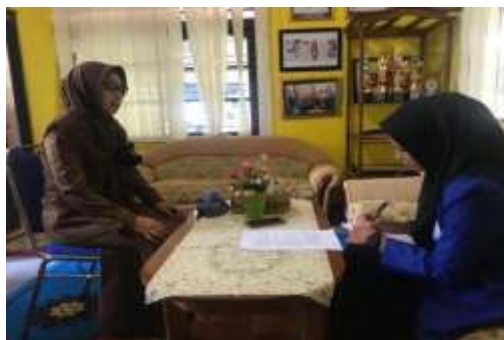
Gambar 4.13 wawancara dengan pendidik

Untuk kendal itu pasti ada dalam pelaksanaan program, jadi sebagai pelaksana program parenting TK Tunas Harapan, jadi setiap pelaksanaan program itu memerlukan masukan berupa komentar dalam hal apapun demi kelancaran pelaksanaan program parenting selanjutnya.