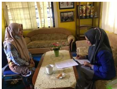
Gambar 4.10 Wawancara dengan pendidik sekaligus orang tua anak

Berdasarkan wawancara yang dilakukan bersama salah satu guru TK