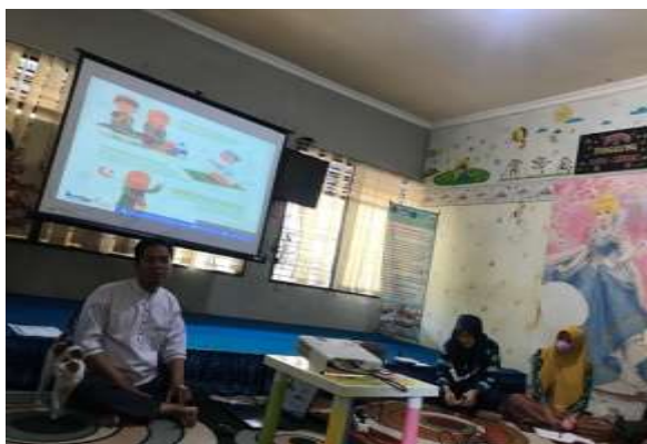
Gambar 4.5 Kegiatan parenting orang tua

Kegiatan yang dilakukan di senta panggung TK Tunas Harapan selama proses pelaksanaan program parenting dan evaluasi program tersebut dari awal