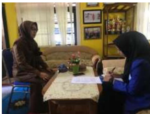
Gambar 4.4 Wawancara dengan Pendidik

Bahwa program parenting ini sudah dijalankan dari awal dibukanya TK Tunas Harapan, program ini sudah berjalan dengan cukup baik dan merupakan program yang rutin dilaksanakan 2 bulan 1 kali. Karena menurut kami program parenting ini merupakan program yang wajib diikuti oleh orang tua, sebab disana kita banyak belajar tentang bagaimana cara mendidik anak yang baik untuk perkembangan anak dimasa yang akan datang. Setelah kami melaksanakan program parenting kami melakukan evaluasi terhadap program tersebut. 18