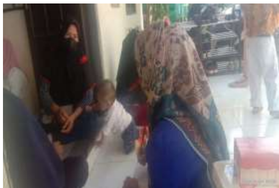
Gambar 4.12 wawancara dengan orang tua anak.

membersihkan tempat tidur, menyiapkan makanan, dan hal-hal kecil yang bisa dibantu oleh anak, mengajarkan anak untuk bertanggung jawab serta orang tua mendidik anak sesuai dengan tahapan perkembangannya.