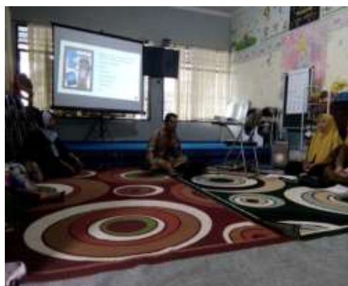
Gambar 4.2 Kegiatan Seminar Orang Tua